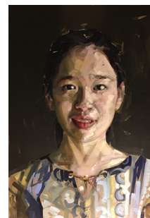
Loulou Huile sur toile 130 x 89 cm