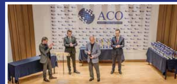
Sonderpreis: Ältester Teilnehmer