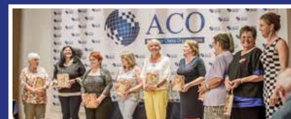
Sonderpreise für alle teilnehmenden Damen