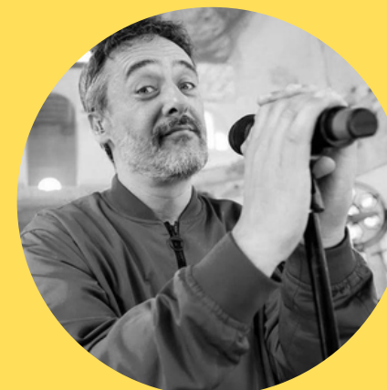
Santi Balmes Love Of Lesbian