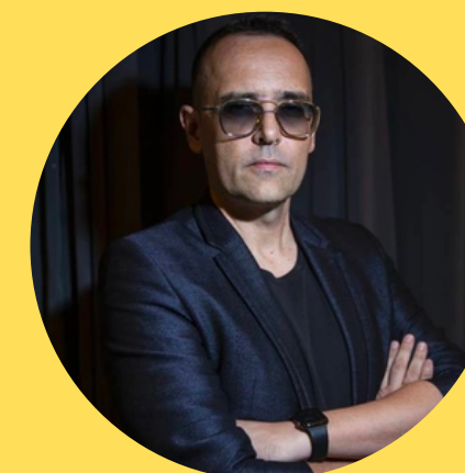
Risto Mejide Presentador, escritor y publicista