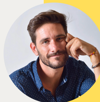
Javier Santaolalla Creador