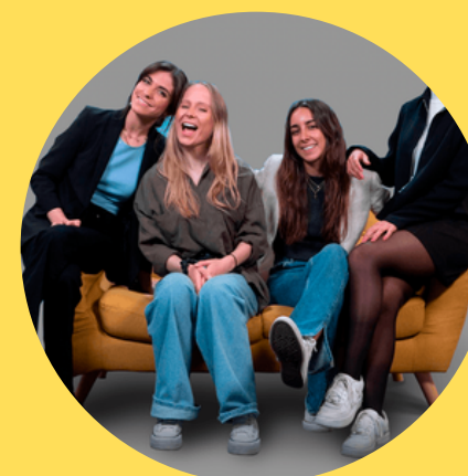
Ac2ality Medio de Comunicación