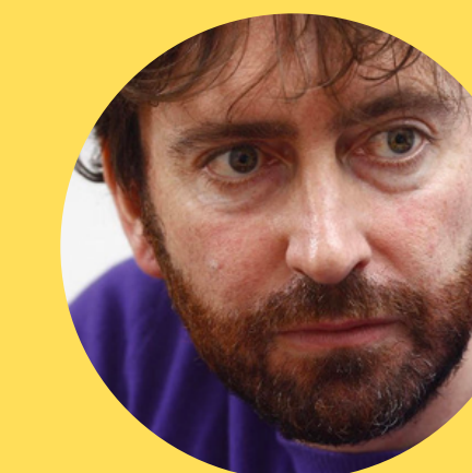
Daniel Sánchez Arévalo Guionista, Director de Cine y Novelista