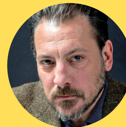
Ray Loriga Escritor