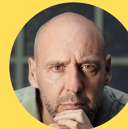
Jaume Balagueró Director de cine