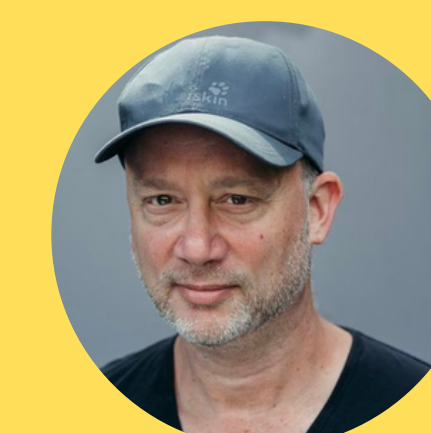
Jon Hamm FREE TURN ENTERTAINMENT