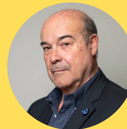
Antonio Resines Actor