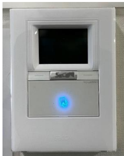
既設カードリーダー（出勤時は No タッチ）