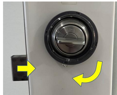
電気錠（顔認証 OK 時、自動で回転）