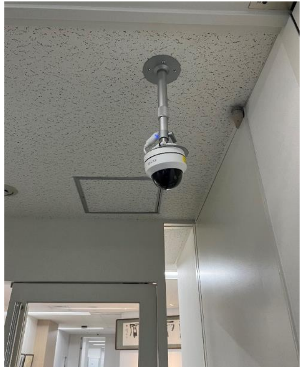
天井の新設 IP カメラ（イメージ）