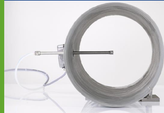
DEBETEK Düsensystem Innenansicht im Zuluftkanal