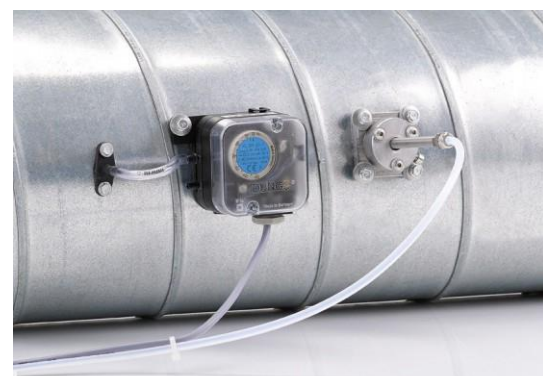
Differenzdruckwächter 24 V DC und DEBETEK Düsensystem an einem Zuluftkanal