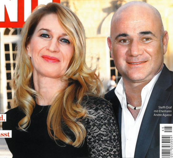
Steffi Graf mit Ehemann Andre Agassi

Der wahre Grund, warum sie sich nicht scheiden lässt