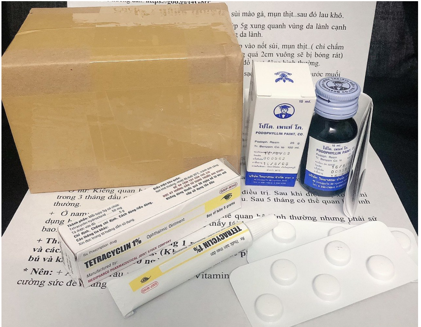
8 Hình ảnh sùi mào gà giai đoạn cuối và thuốc trị Triệt Để, Thuốc trị liệu Sùi Mào Gà Podophyllin 25 tại nhà