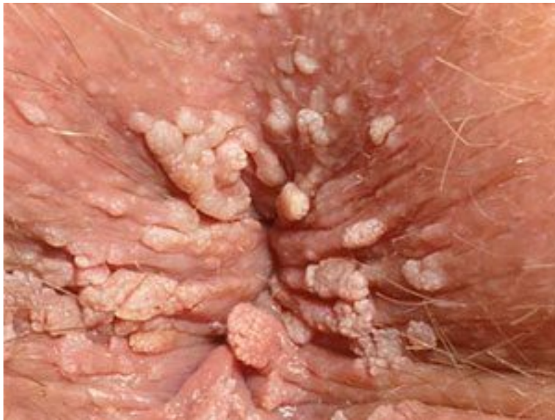
8 Hình ảnh sùi mào gà giai đoạn cuối và thuốc trị Triệt Để

là mụn thịt mọc tại các vị trí khác nhau vùng hậu môn.