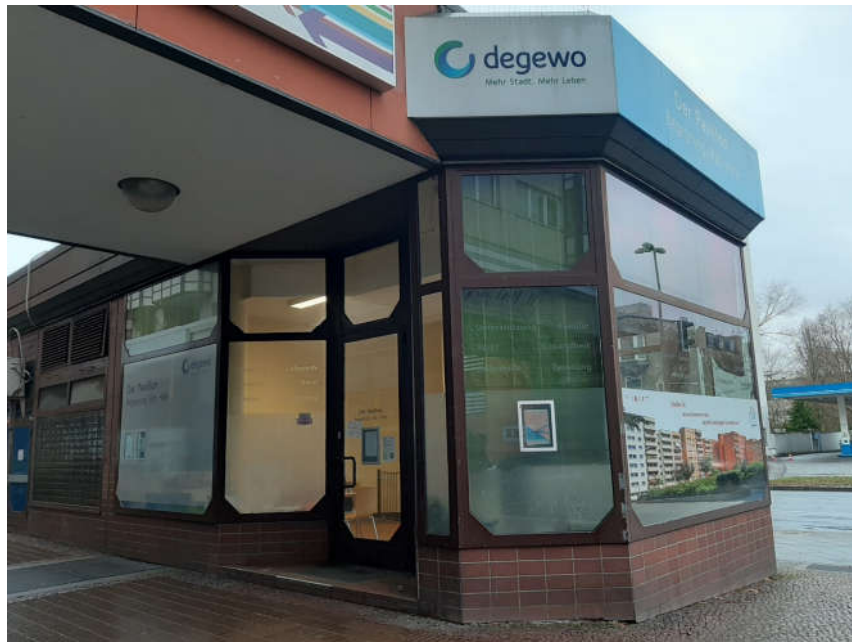
9. April 2021