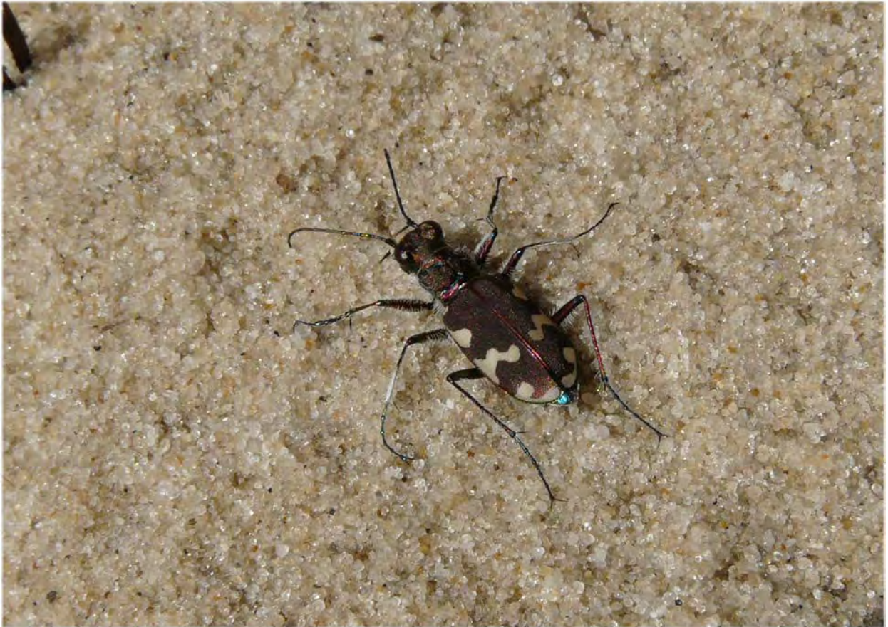
Der Dünensandlaufkäfer lebt räuberisch und ist bei Sonnenschein in Heiden gut zu beobachten