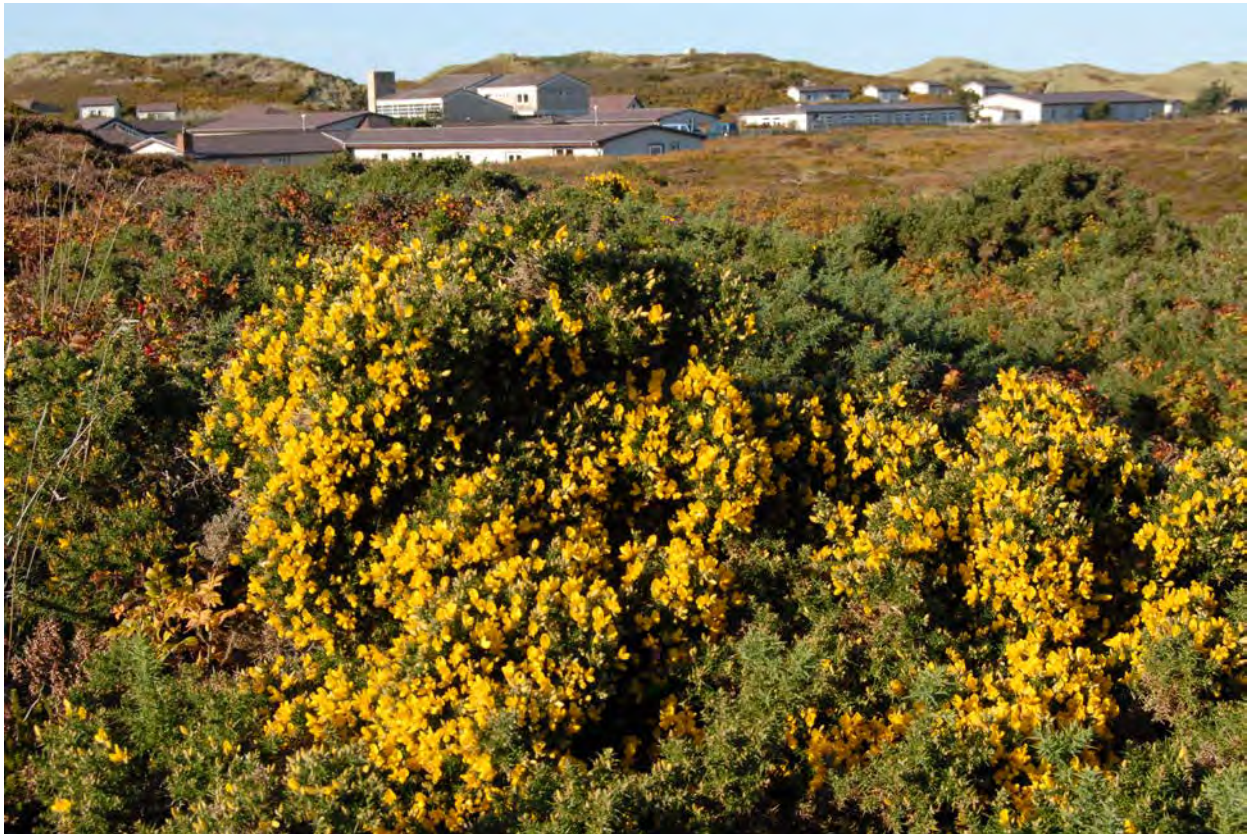
Klappholttal im Herbst: Einzelne Sträucher des Stechginsters blühen zu dieser Jahreszeit. 13.10.2009