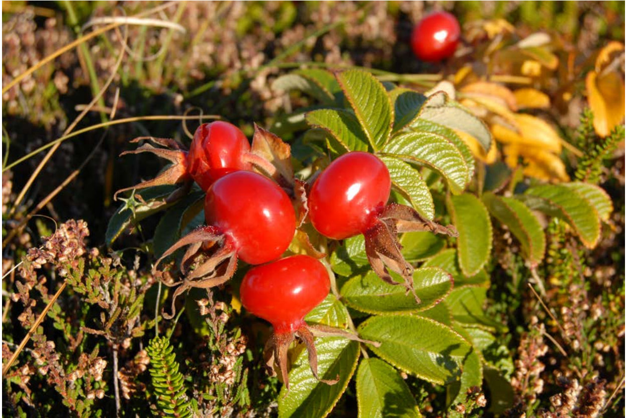
Die Früchte der Kamtschatkarose werden von Vögeln gefressen, die Samen über den Kot verbreitet („Ornithochorie“) 13.10.2009