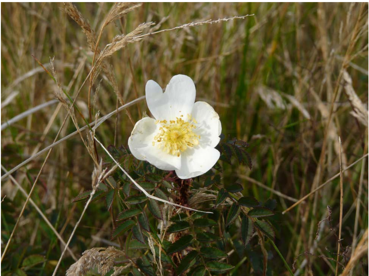
Die auf Sylt heimische Dünenrose blüht im Frühjahr; im Herbst kann es eine zweite Blütezeit geben. Gegenüber dem Neophyten Kamtschatkarose ist die Dünenrose sehr dezent 6.10.2009