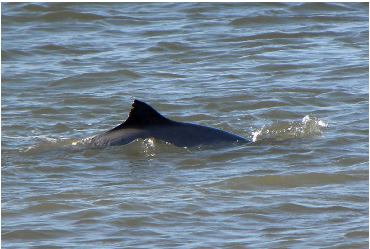
Schweinswale schwimmen gerne in Strandnähe und scheinen den Strandwanderer zu begleiten