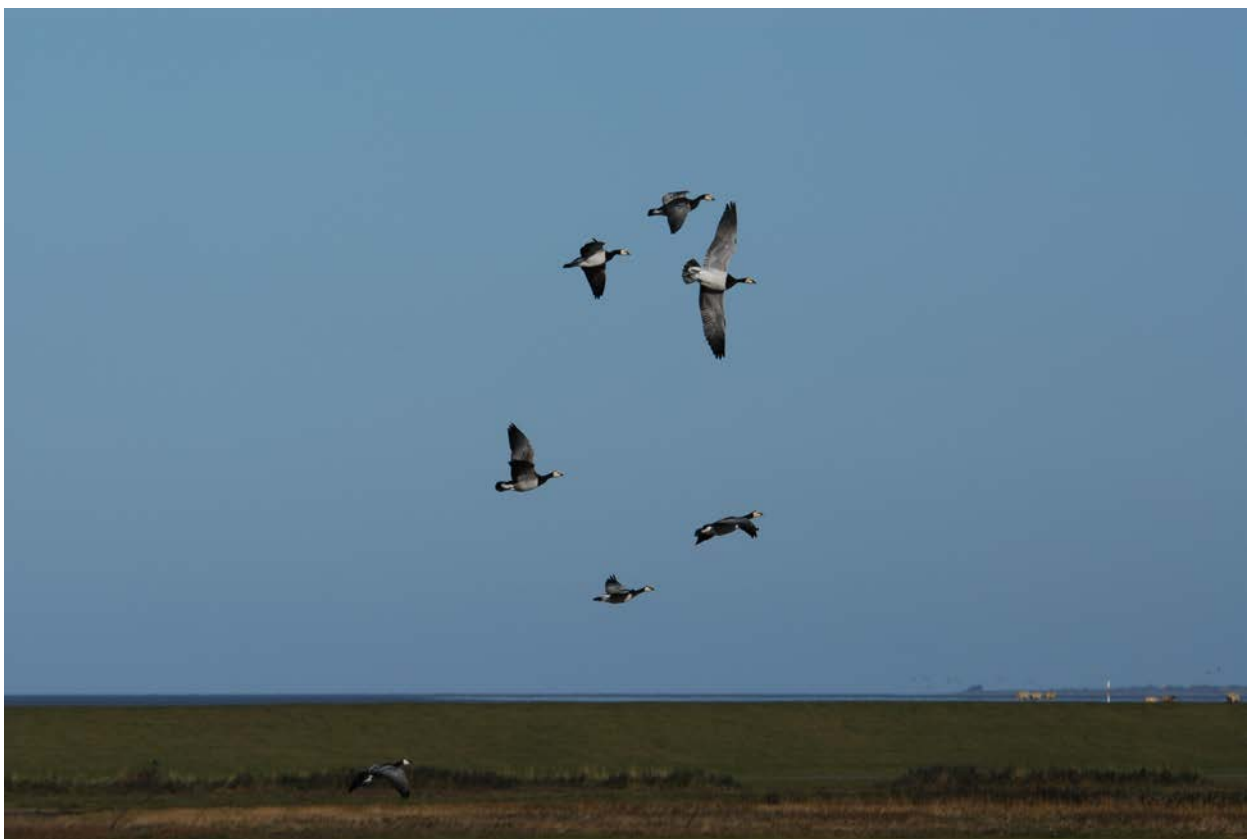
Nonnengänse im Landeanflug am Hindenburgdamm 17.10.2009