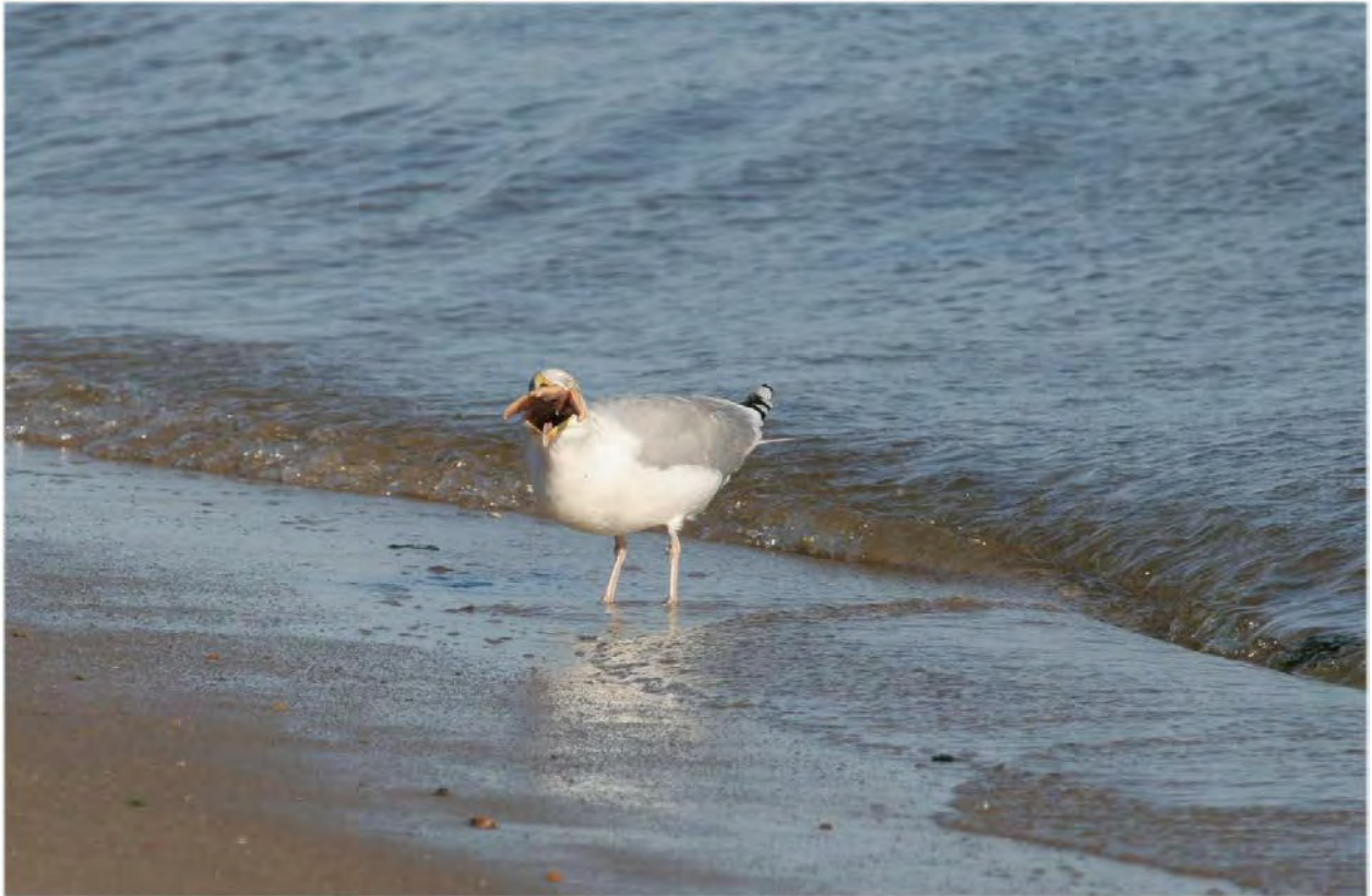
mit zwei Armen voran und drei Armen hinteran scheint das Schlucken zu gelingen..... 29.9.2009