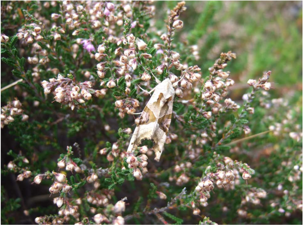
Eine Achateule ist ein Wanderfalter und vermag bei uns als Falter zu überwintern 11.10.2010