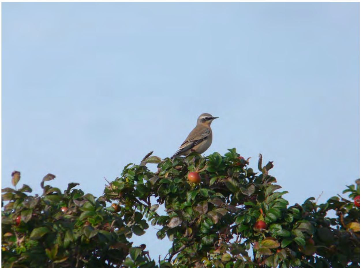
Durchziehende Steinschmätzer nutzen jede sich anbietende Erhöhung, hier die Kamtschatkarose als Warte 9.10.2009