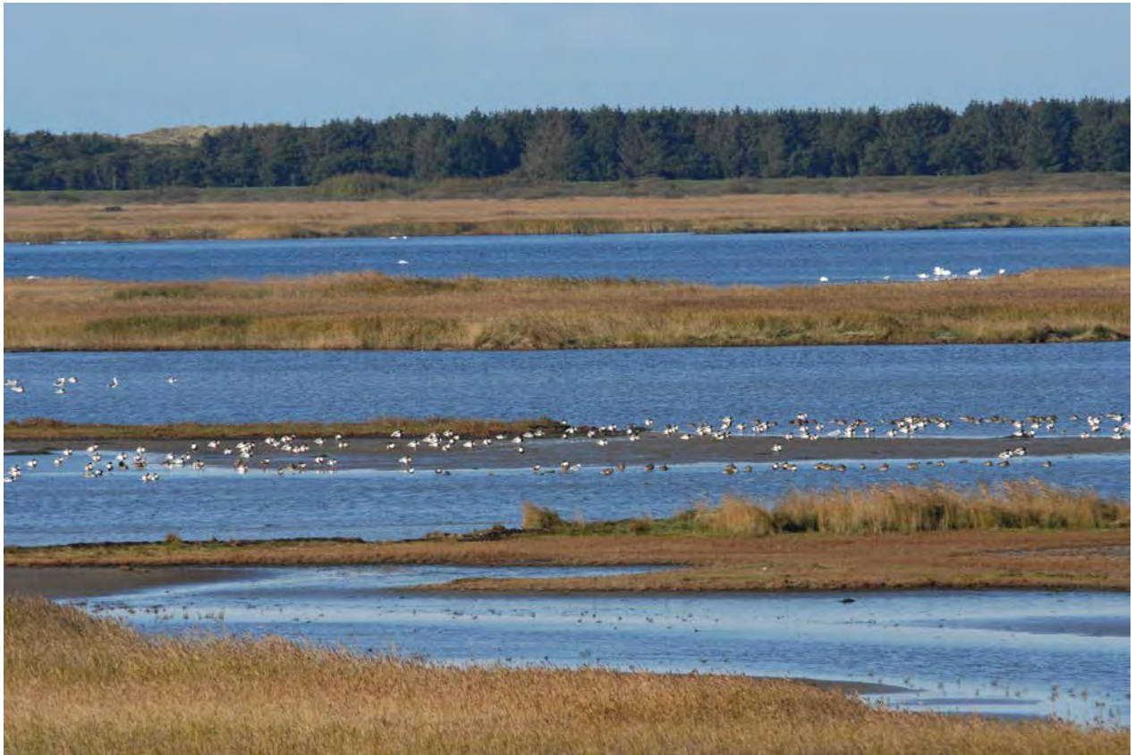
In den Flachwasserbereichen des Rantumbeckens sammeln sich sehr viele Limikolen und Entenvögel während der Hochwasserzeiten im Wattenmeer