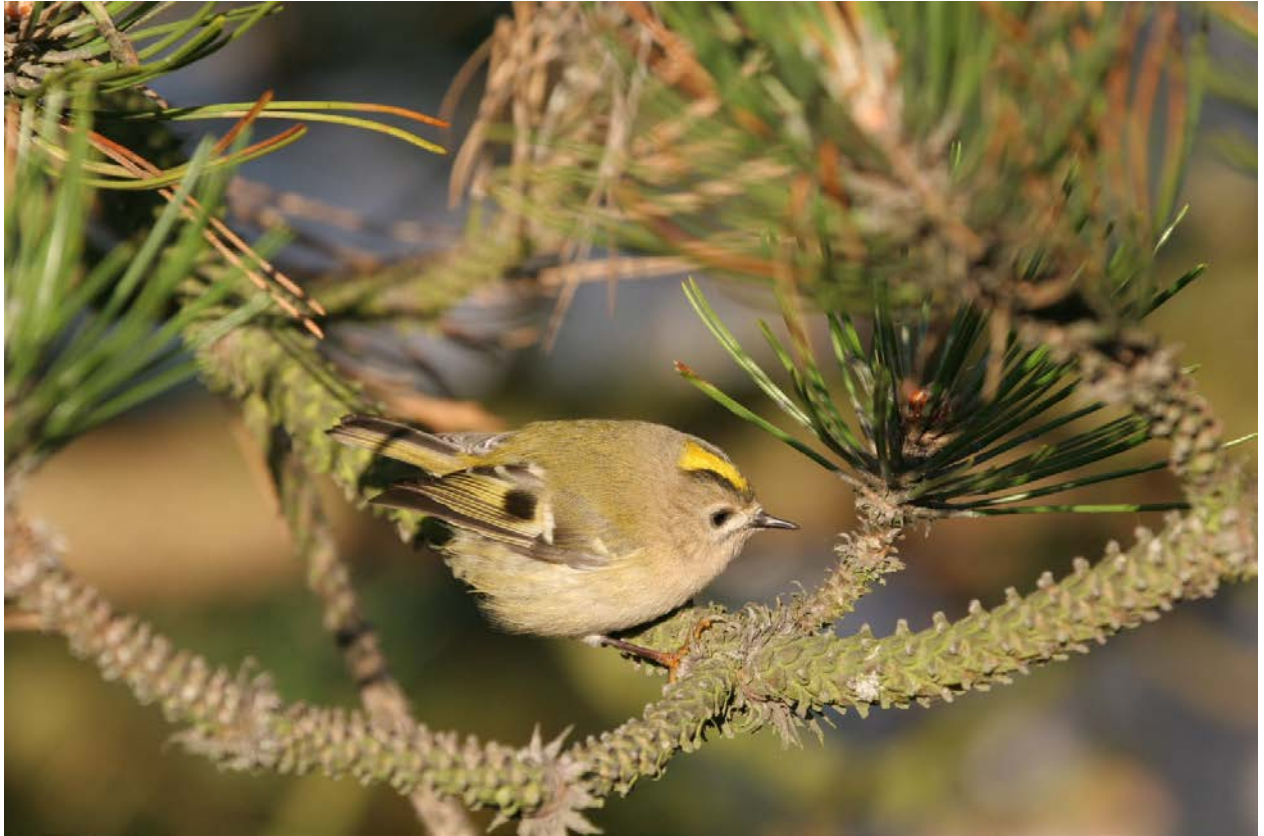
Während des Herbstzuges tritt das Wintergoldhähnchen auf Sylt zuweilen in großer Anzahl auf 13.10.2009