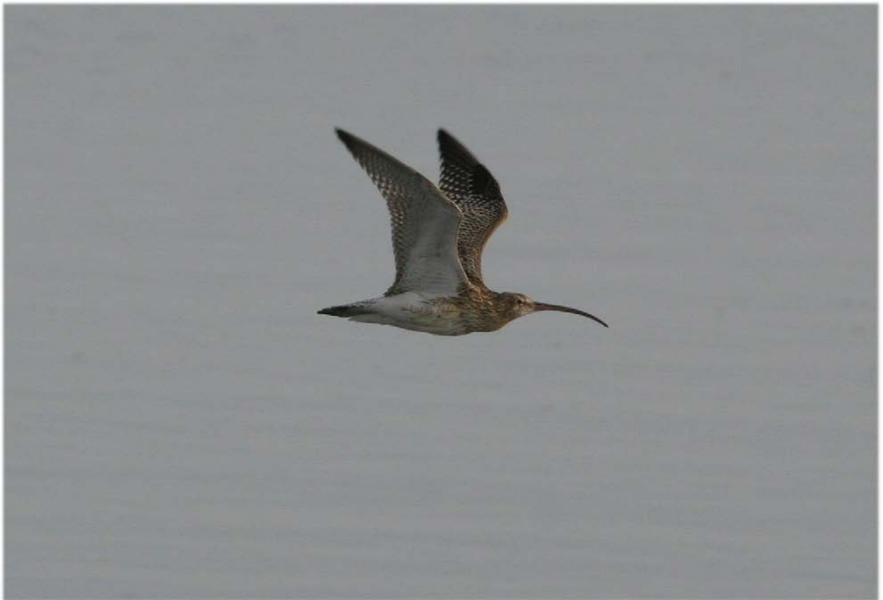
Brachvögel halten sich von Juni bis März im Wattenmeer auf, weil sie dort ein reiches Nahrungsangebot vorfinden 9.10.2009