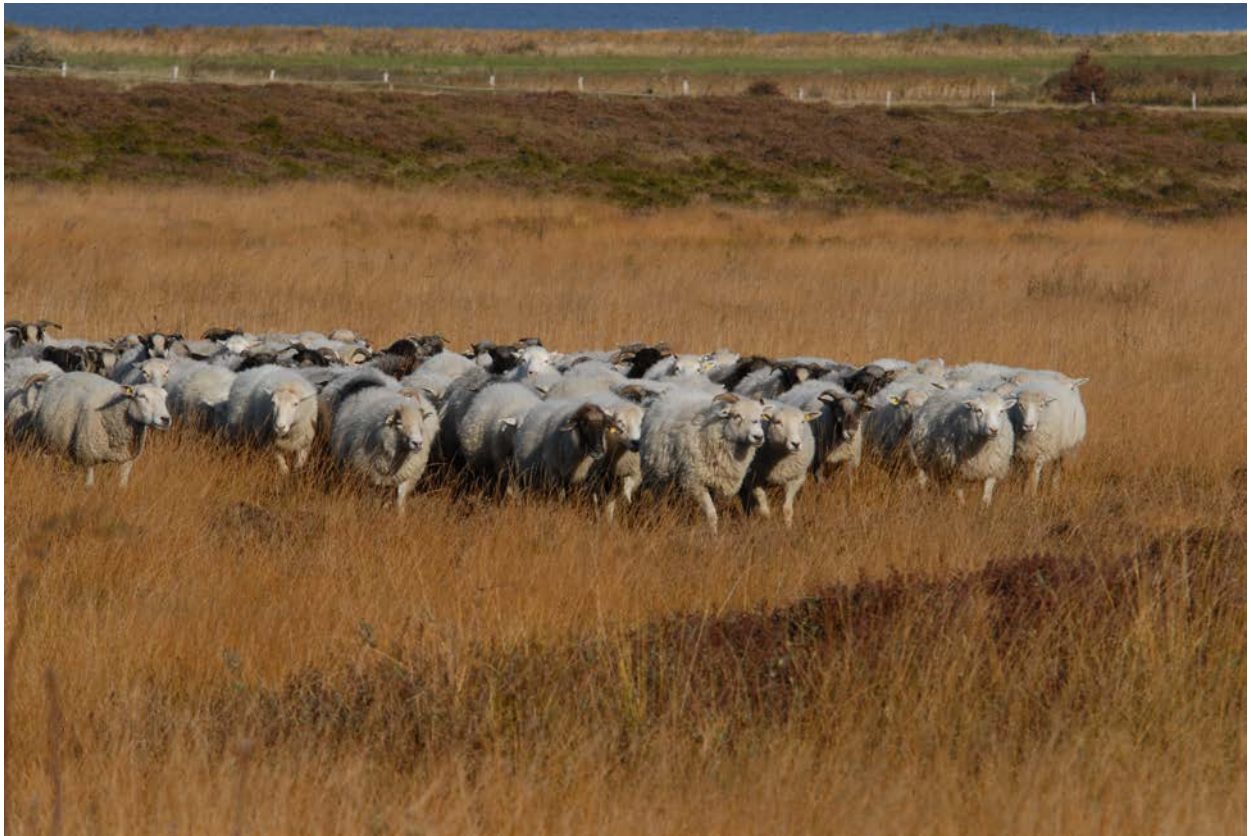
Die Morsumer Heide wird mit einer Schnuckenherde gepflegt 15.10.2009