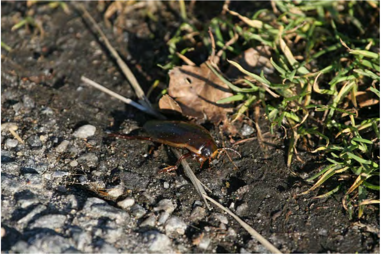
Ein Gelbrandkäfer-Männchen krabbelt auf dem Schotterweg in Klappholttal 14.10.2009