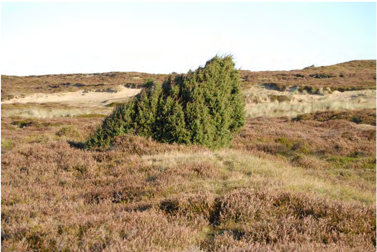
Der Wacholder ist neben der Eibe der einzige natürlich vorkommende Nadelbaum auf Sylt; Morsumer Heide 13.10.2009