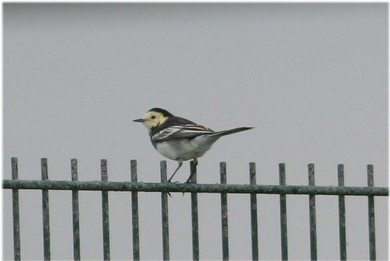
Die Trauerbachstelze gehört zu den regelmäßigen Erscheinungen auf Sylt