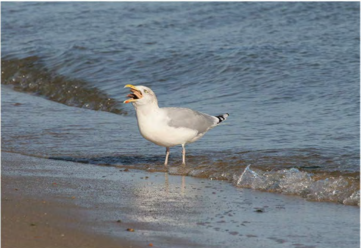
Die Gier siegt und der Seestern verschwindet im Schlund der Möwe 29.9.2009