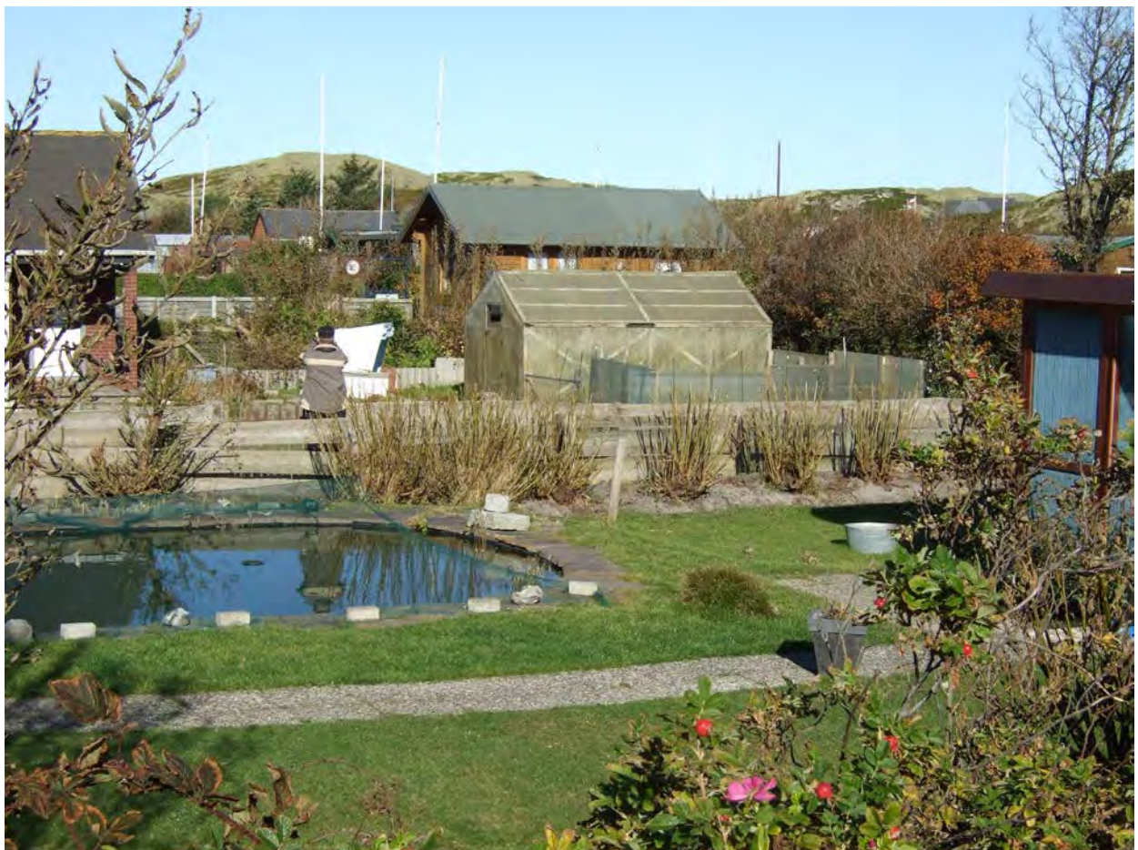
Die nördlich von Hörnum in ein Dünenatal eingebetteten Kleingärten sind für Kleinvögel sehr attraktiv 14.10.2009