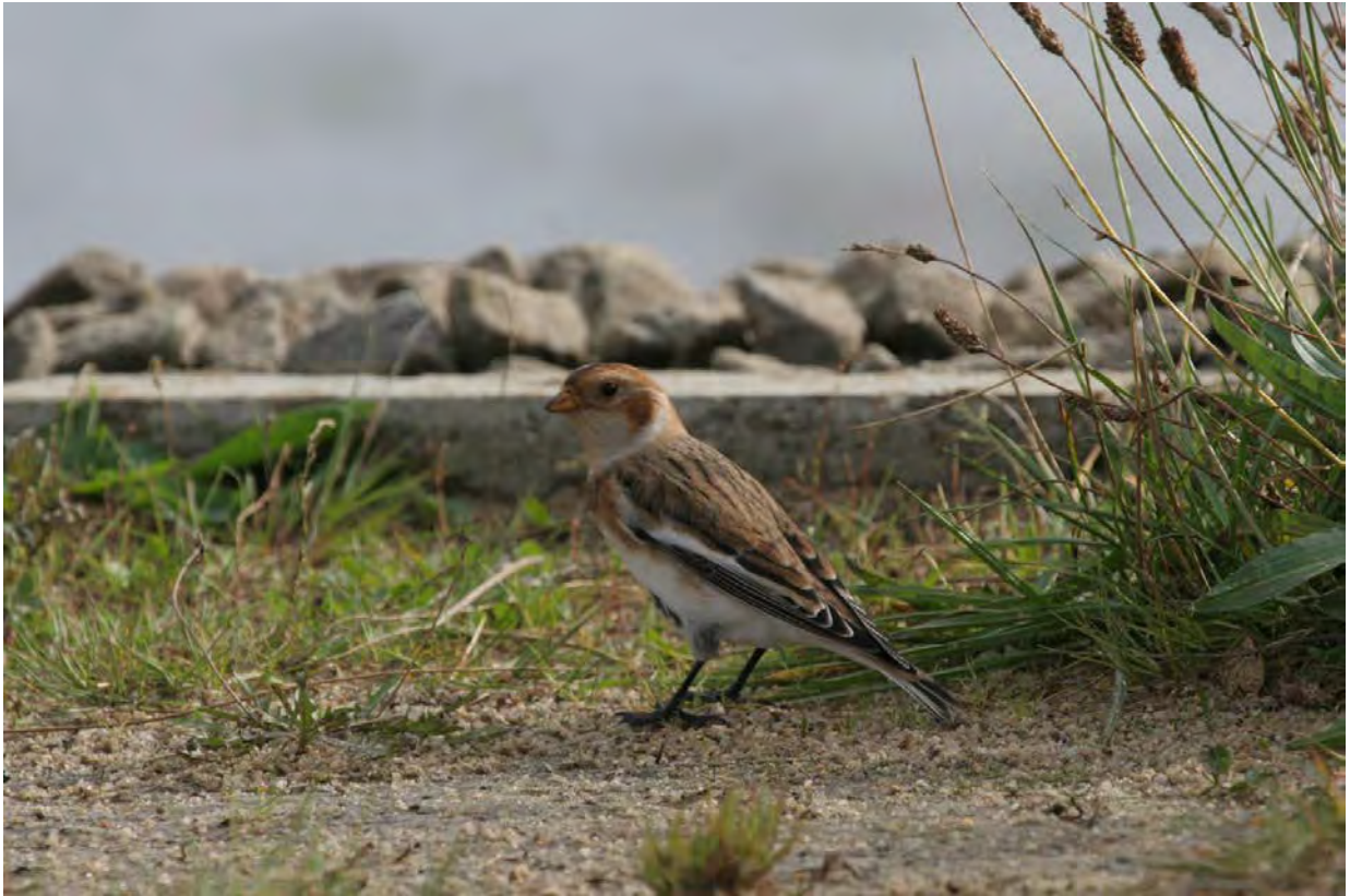
Eine Schneeammer bei Munkmarsch

5.10.2009