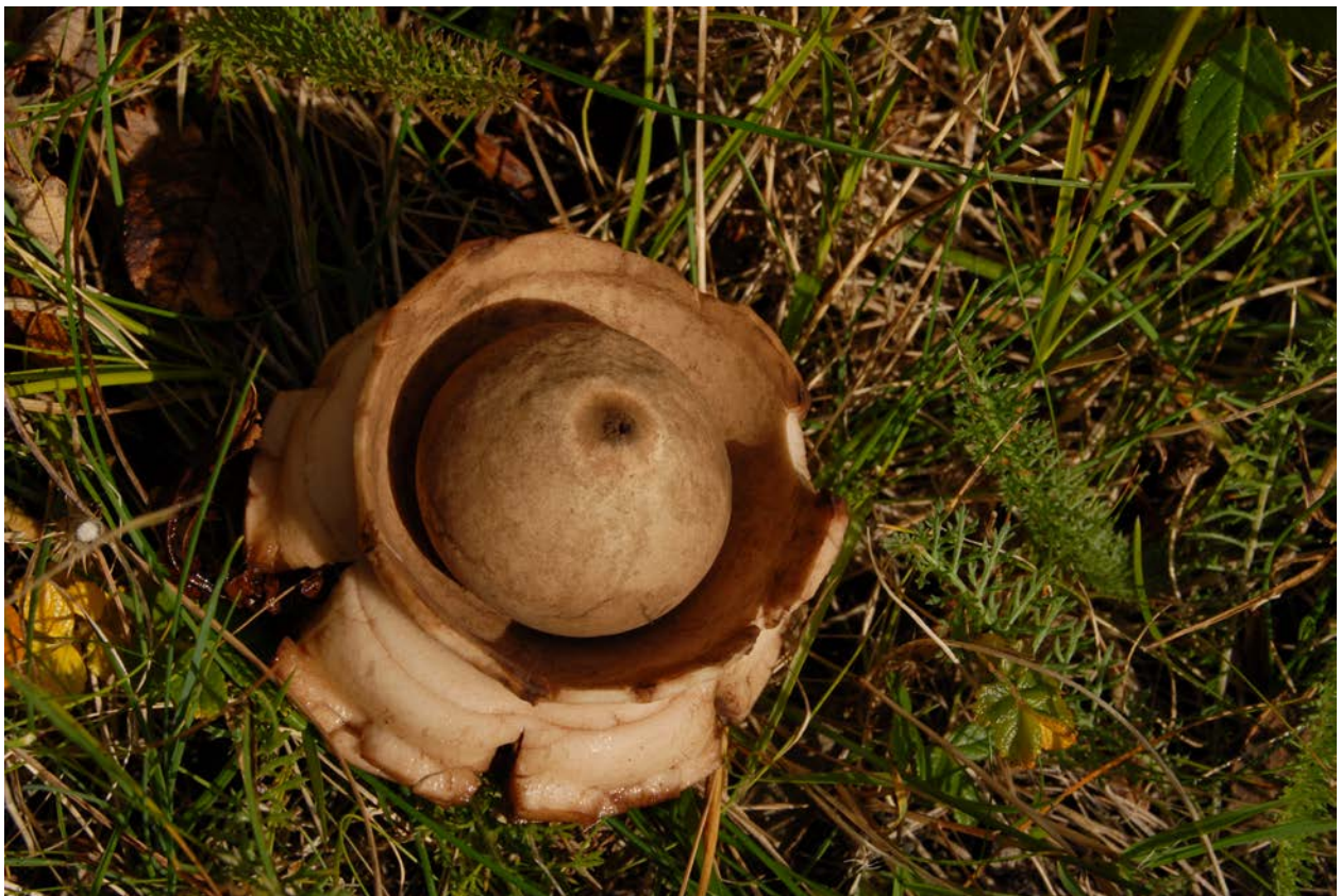
Der Erdstern ist ein durch seinen Habitus auffallender Pilz, von Birgit Hussel in Westerland entdeckt