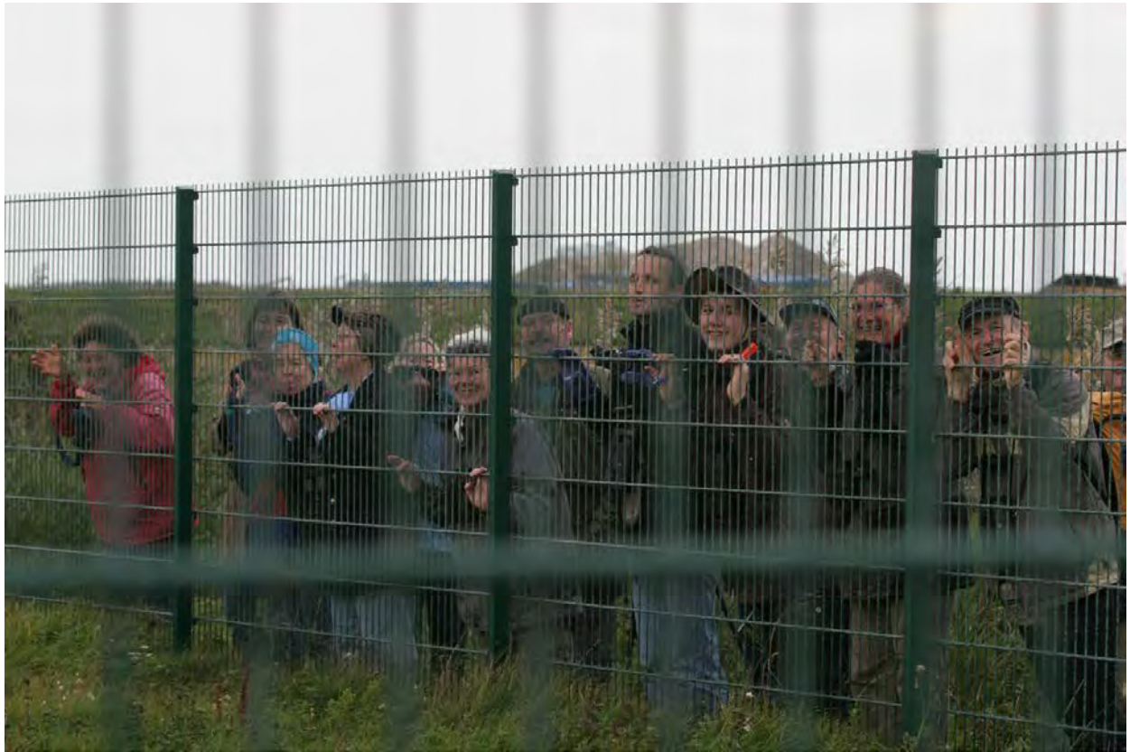
Aus dem Blickwinkel der Gebirgsstelzen an der Kläranlage am Rantumbecken 11.10.2009