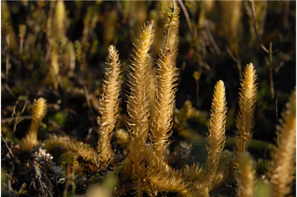
Der äußerst seltene Sumpfbärlapp in einem Düental auf Sylt