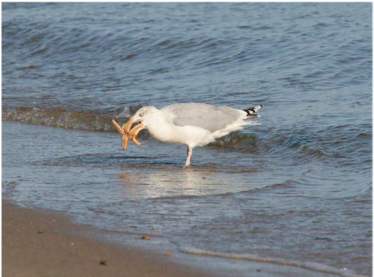
Ein großer Seestern wird von einer Silbermöwe gegriffen...

5.10.2009