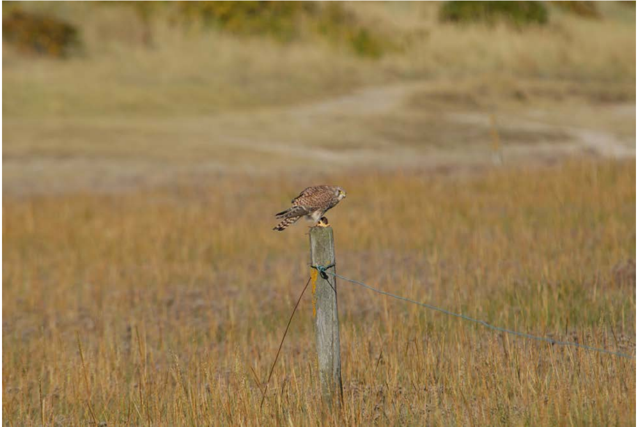
Ein Turmfalke kröpft eine Maus, die er in den Dünen bei der Hörnumer Nehrung erbeutet hat 14.10.2009