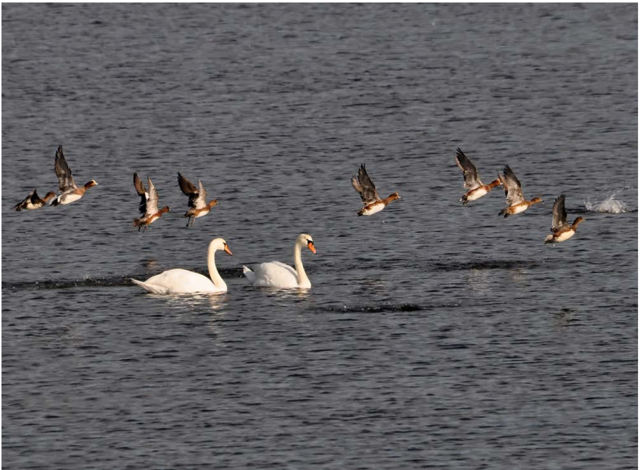
Höckerschwäne und Pfeifenten im Rantumbecken-Süd 11.10.2012