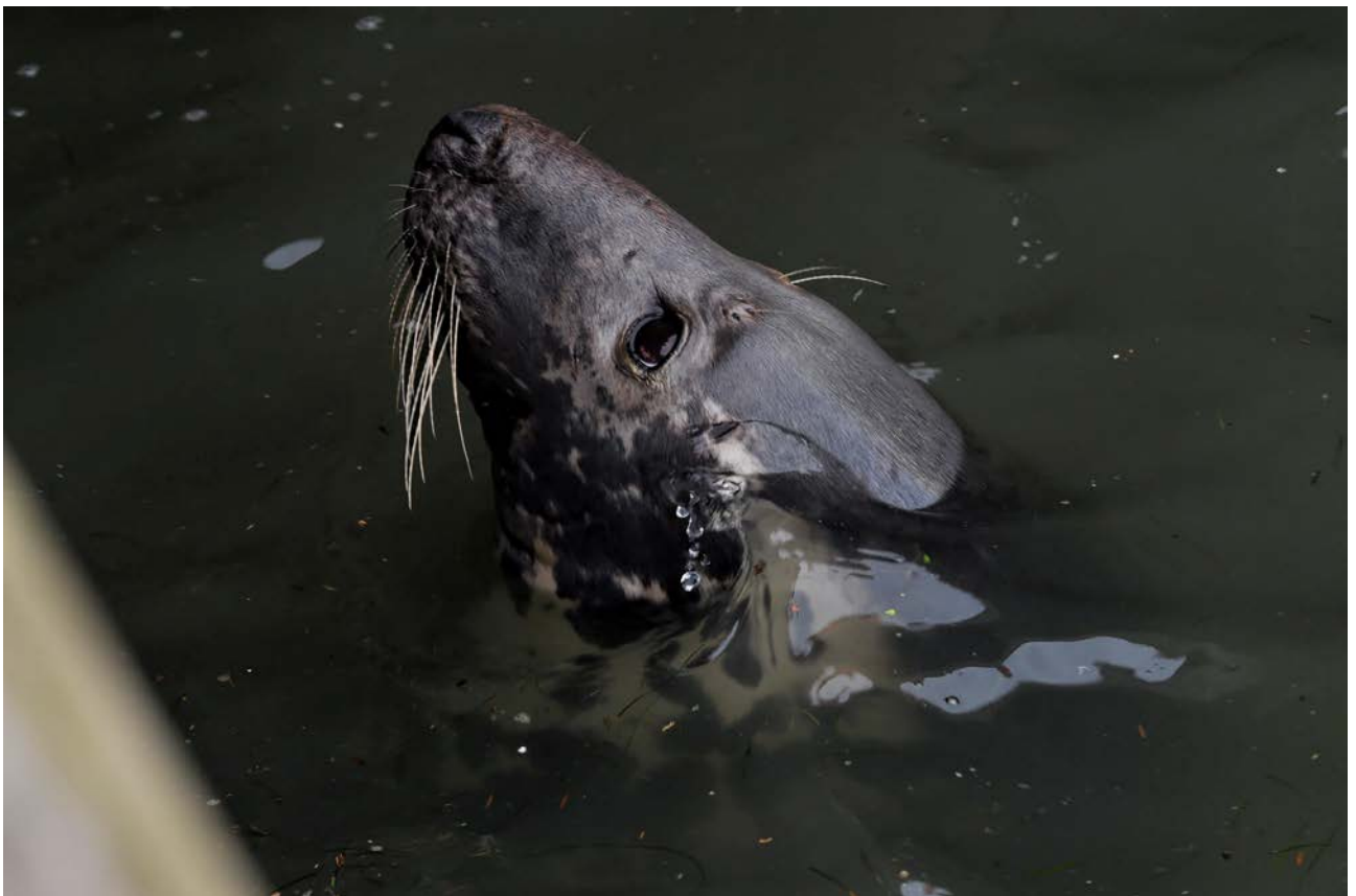
Kegelrobbe im Hörnumer Hafen 12.10.2012