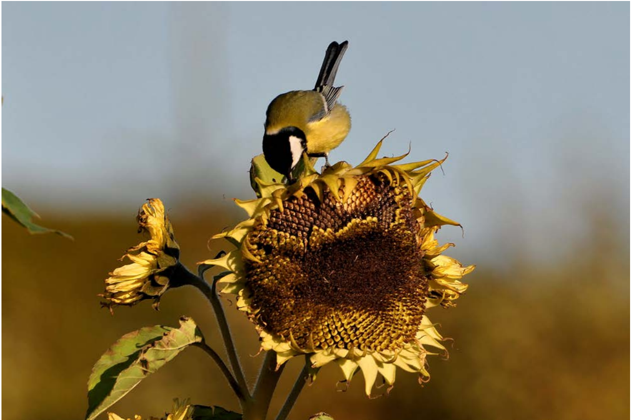
Kohlmeise in den Hörnumer Gärten 12.10.2012