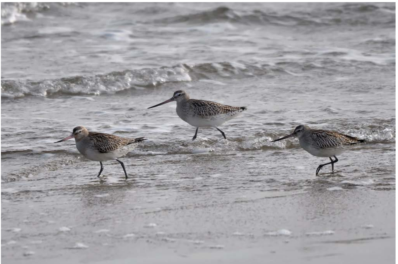
Pfuhschnepfen am Königshafen 7.10.2012