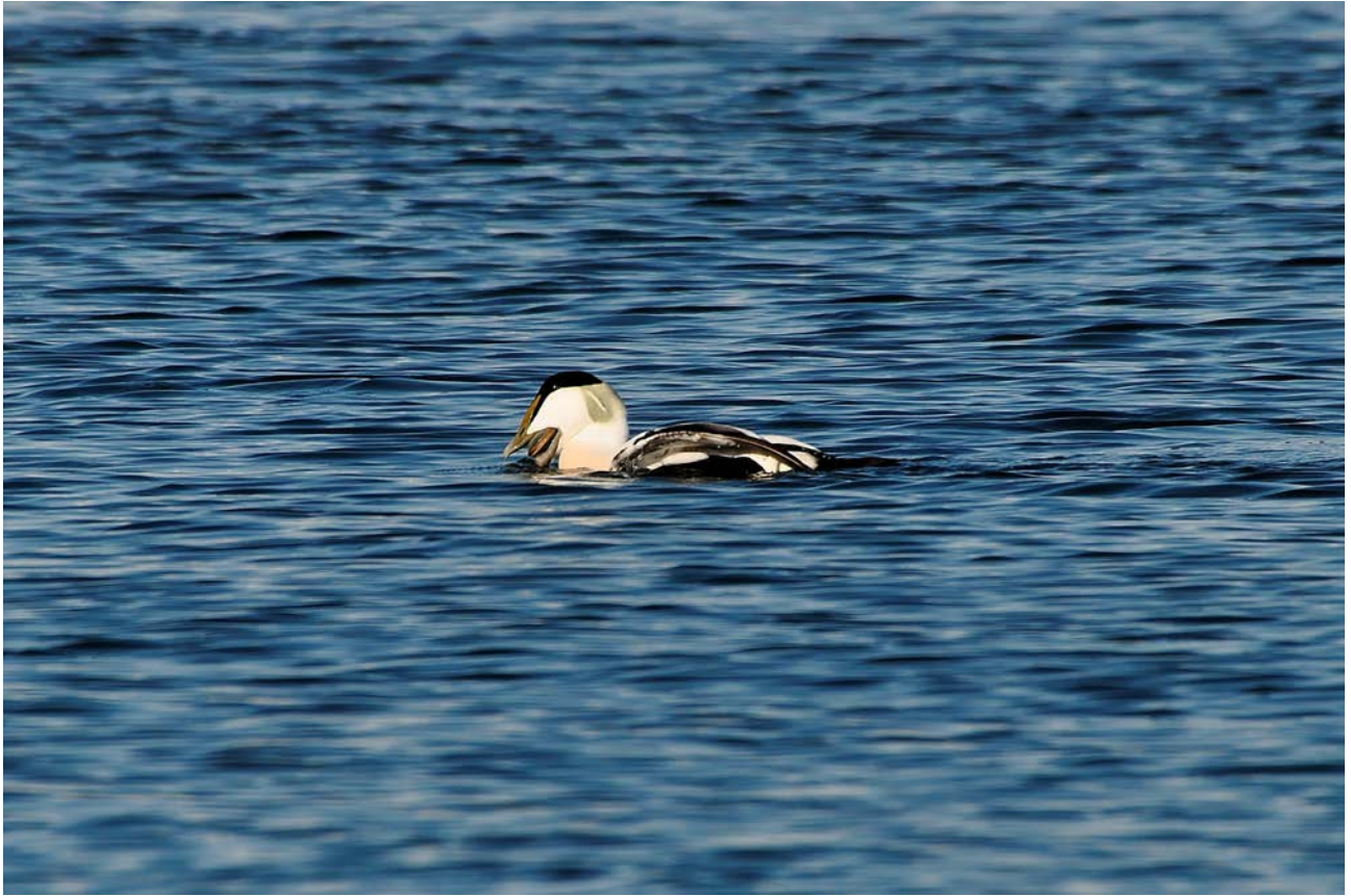
Eiderente mit Miesmuschel am Ellenbogen 11.10.2012