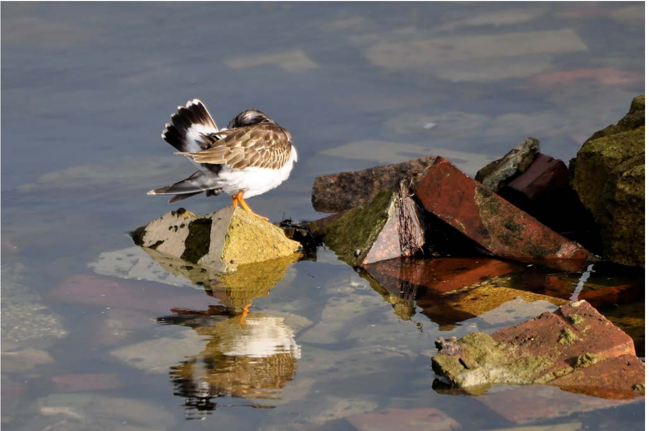
Steinwälzer Rantumbecken Süd (Wattseite) 11.10.2012