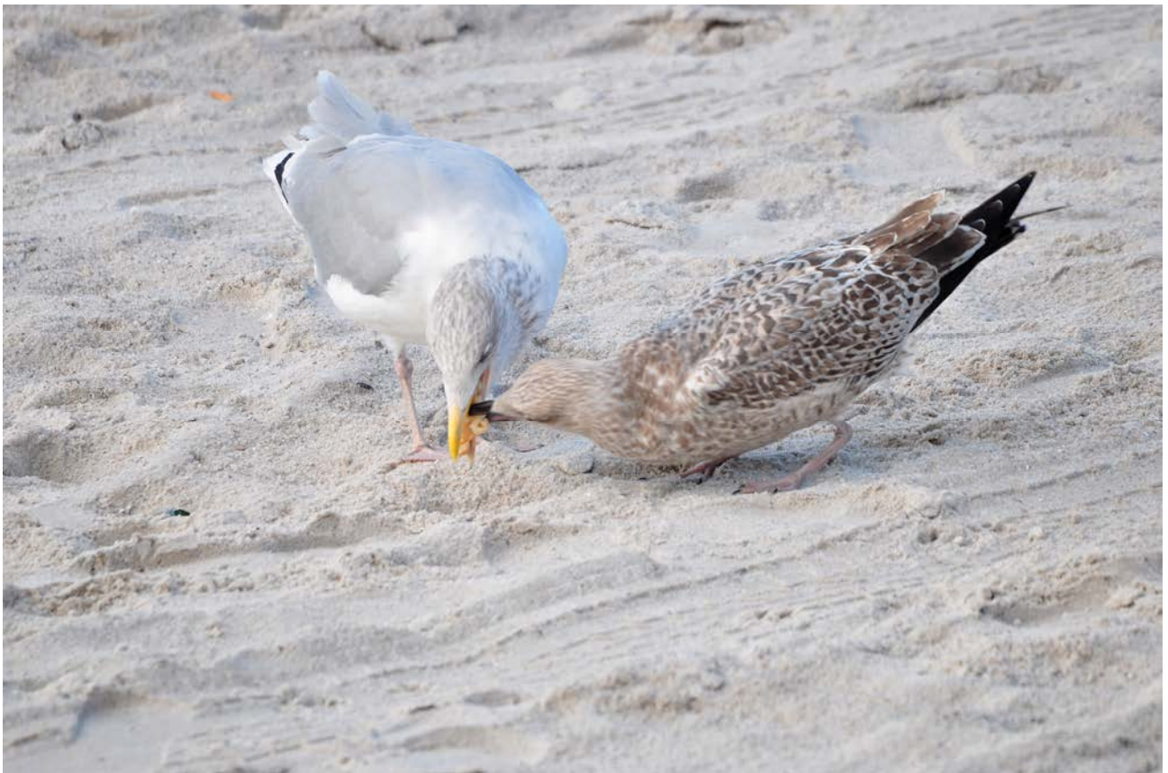
Silbermöwen-Fütterung Westerland 10.10.2012