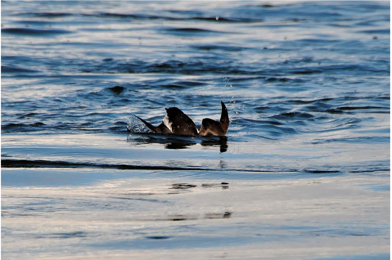
Trottellumme am Ellenbogen 11.10.2012