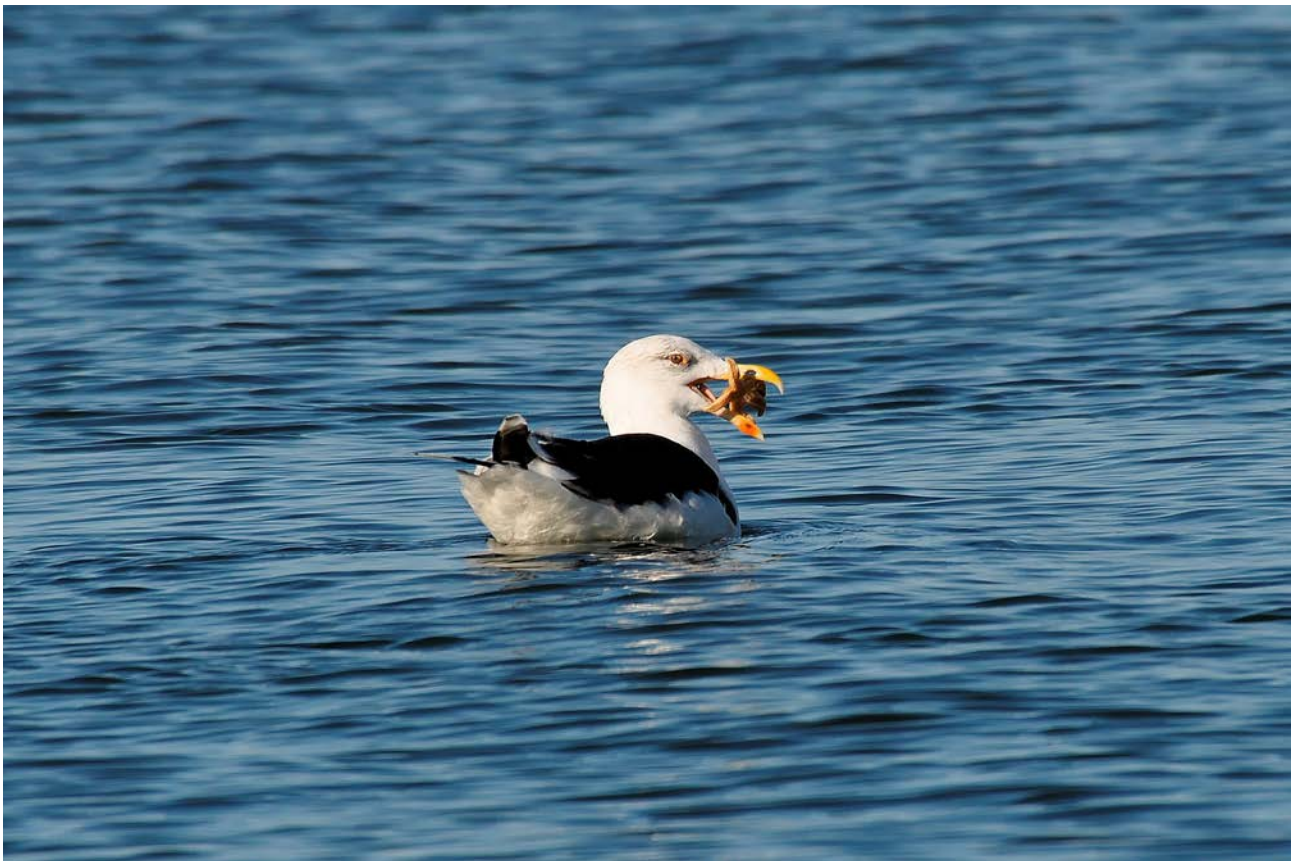
Mantelmöwe mit Seestern am Ellenbogen 11.10.2012