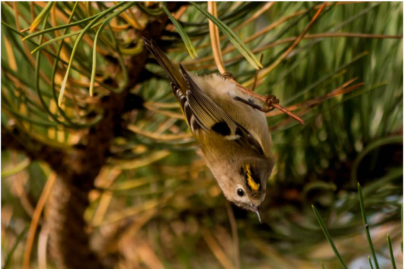
Wintergoldhähnchen Klappholttal 6.10.2012