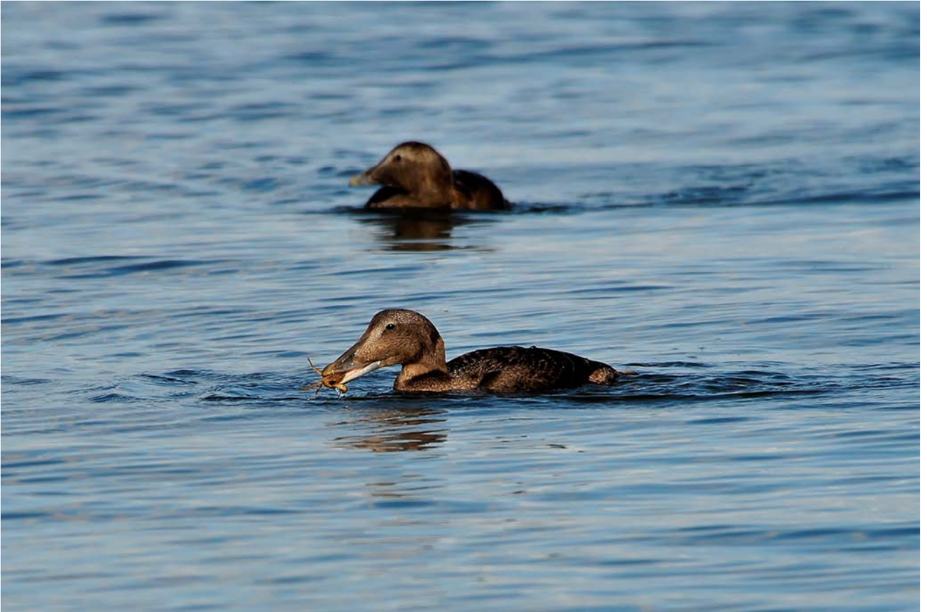
Eiderente mit Strandkrabbe am Ellenbogen 11.10.2012