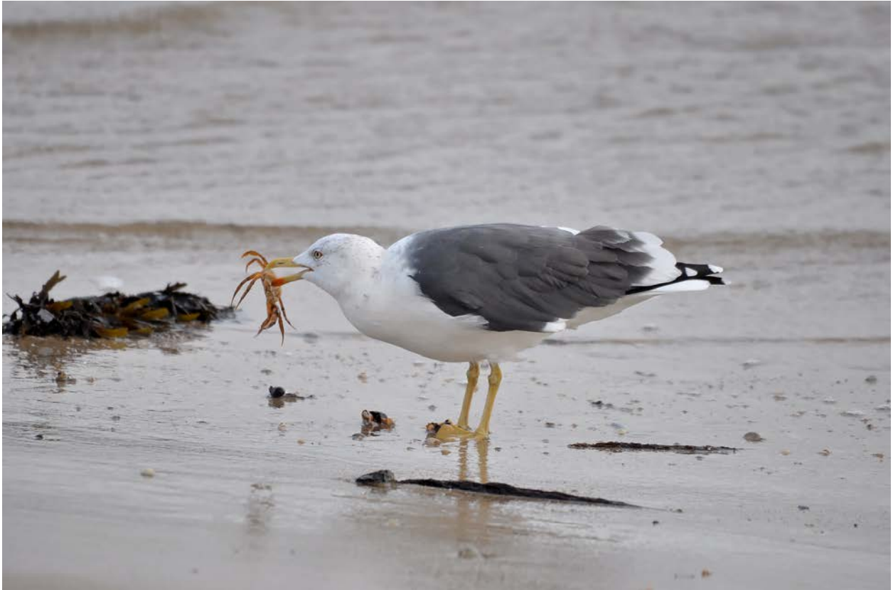
Heringsmöwe am Königshafen 7.10.2012