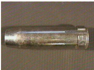
40609 Gasdüse konisch, MR 36, NW 16 mm 40610 Gasdüse MR 36 super konisch, NW14 mm 40611 Gasdüse zylindrisch, MR 36, NW 19 mm