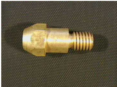
40644 Düsenstock M 8/M 6, 28 mm, MR 36 40645 Düsenstock M 8/M 8, 28 mm, MR 36