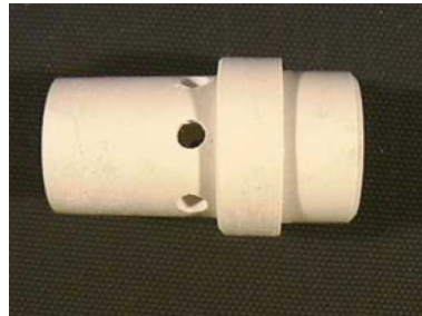
40632 Gasverteiler MR 36, 33 mm