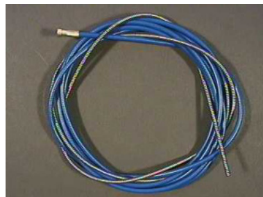
40660 Drahtführungsspirale 3 m, blau, 15/45, isoliert m. Hülse 40661 Drahtführungsspirale 4 m, blau, 15/45, isoliert m. Hülse 40662 Drahtführungsspirale 5 m, blau, 15/45, isoliert m. Hülse