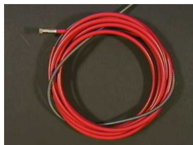
40663 Drahtführungsspirale 3 m, rot, 20/45, isoliert m. Hülse 40664 Drahtführungsspirale 4 m, rot, 20/45, isoliert m. Hülse 40665 Drahtführungsspirale 5 m,rot, 20/45, isoliert m. Hülse