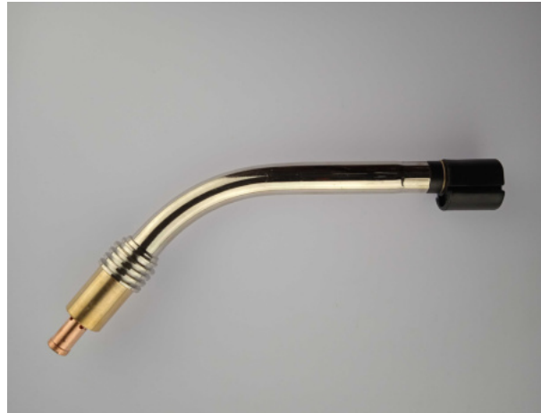
40756 Brennerhals MR 36