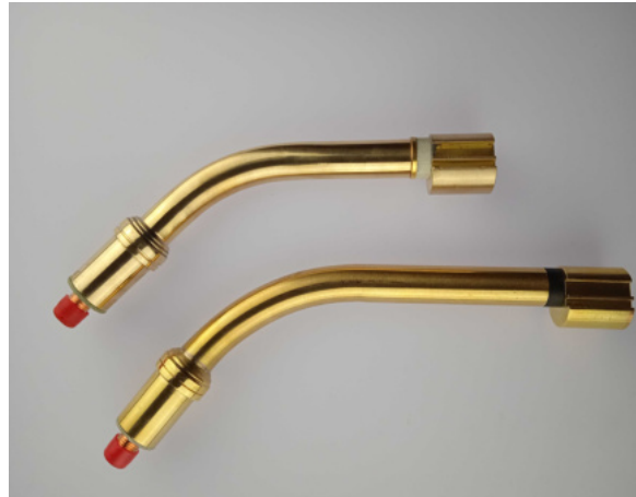
407559 Brennerhals MR 35D 407559L Brennerhals MR 35D, lange Ausführung