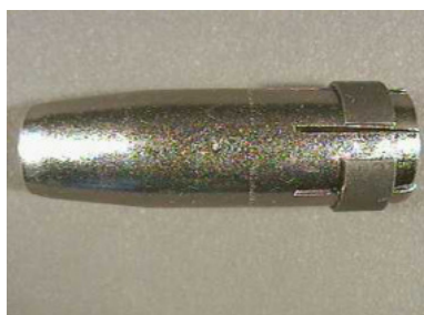
40603 Gasdüse konisch, MR 24/240, NW 12,5