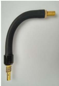
40766 Brennerhals MR 15 flex