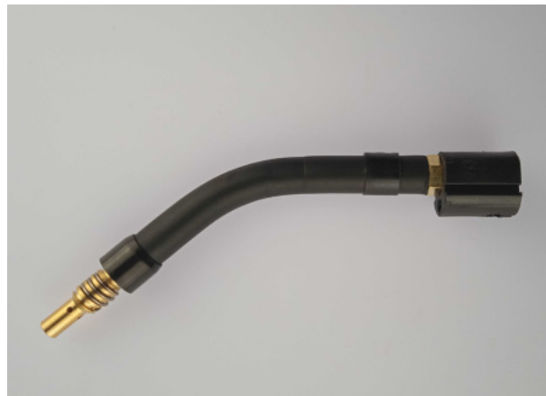
40751 Brennerhals MR 15, steckbar