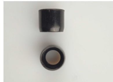
40793 Schutzhülse MR 15