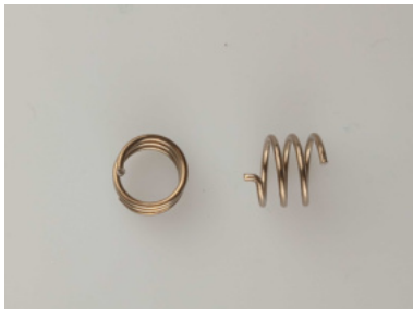
40767 Haltefeder MR 14/15