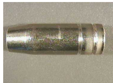
40600 Gasdüse konisch, MR 14/15, NW10 40601 Gasdüse super konisch, MR 14/15, NW10 40602 Gasdüse zylindrisch, MR 14/15, NW16