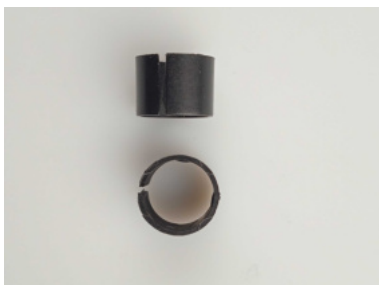
40794 Distanzhülse MR 15