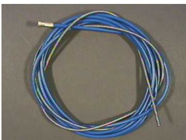
40660 Drahtführungsspirale 3 m, blau, 15/45, isoliert m. Hülse 40661 Drahtführungsspirale 4 m, blau, 15/45, isoliert m. Hülse 40662 Drahtführungsspirale 5 m, blau, 15/45, isoliert m. Hülse