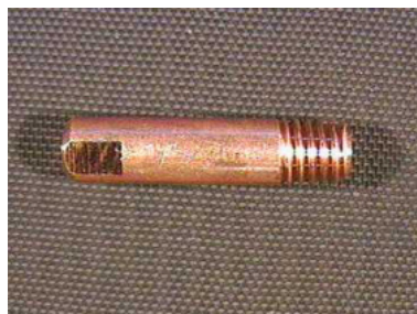
40550 Stromdüse 0,6 mm ø/M 6, 25 mm lang 40551 Stromdüse 0,8 mm ø/M 6, 25 mm lang 40553 Stromdüse 1,0 mm ø/M 6, 25 mm lang