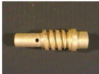
40638 Gasdüsenträger MR 15