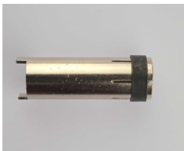
406281 Punktgasdüse MR 24/240