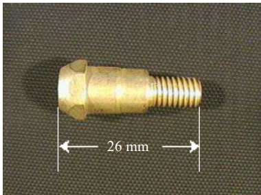
40640 Düsenstock M 6, MR 24/240