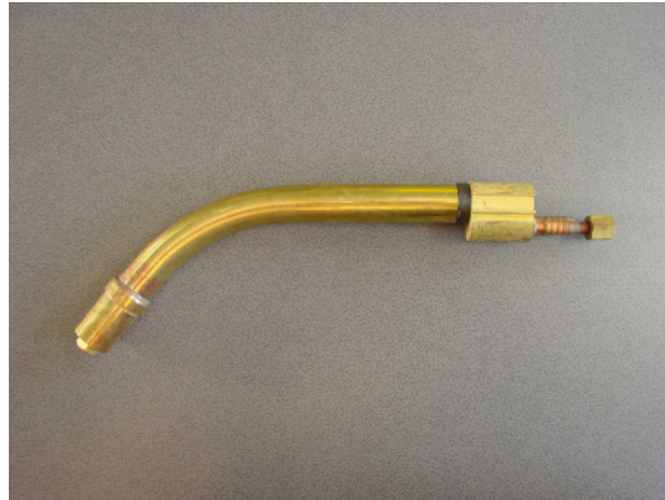
40757 Brennerhals MR 240 D