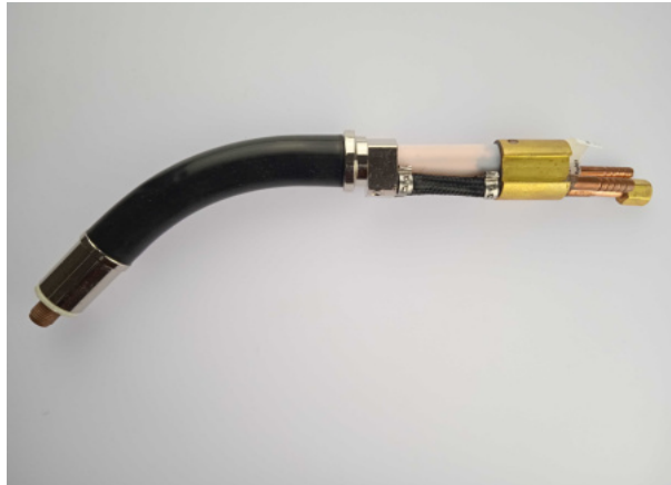
407611B Brennerhals MR 501 D/SC