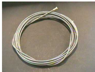
40678 Drahtführungsspirale 3 m, 20/45, blank m. Hülse