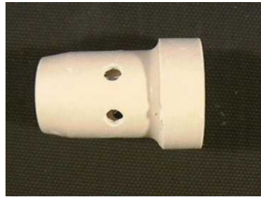
40633 Gasverteiler MR 35/401/501