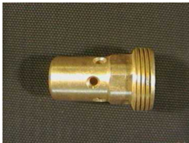
40648 Düsenstock M 8, MR 35/401/501