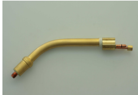
40761N Brennerhals MR 501 D

40470 MIG/MAG-Schweißbrenner MR 401D/3 m