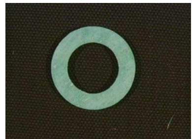
40798 Isolierscheibe MR 35/401D/501D