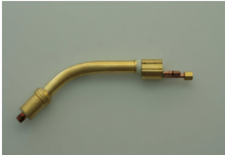
40759N Brennerhals MR 401 D