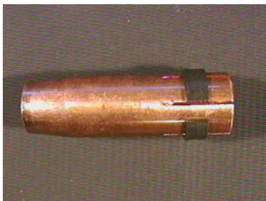
40612 Gasdüse konisch, MR 35/401/501, NW 16 mm