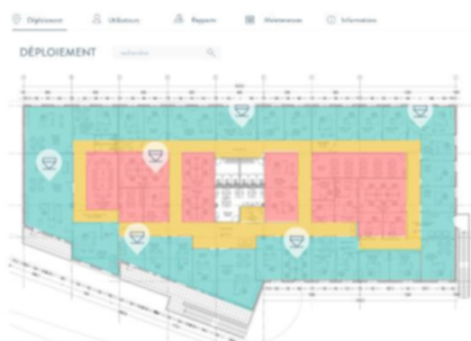
Cartographie des zones à risque de la solution XXX

S'appuyant sur ces recommandations DEKRA met en place, l'évaluation DEKRA Diag'Air, un protocole en trois temps à destination des ERP :