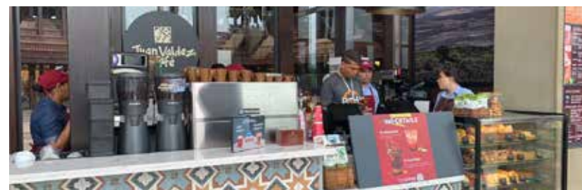
Juan Valdez, Centro Comercial La Serrezuela. Cartagena, Colombia

Por último, inauguramos la primera tienda Juan Valdez en el municipio de Itagüí - Antioquia, en el centro comercial Arrayanes, en una de las zonas comunes. Este nuevo espacio seguirá llevando a los antioqueños lo mejor del café 100% colombiano.