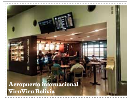
Aeropuerto internacional ViruViru Bolivia