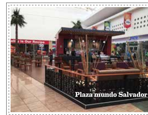
Plaza mundo Salvador