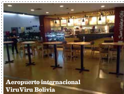
Aeropuerto internacional ViruViru Bolivia

Entre las nuevas aperturas de tiendas durante el primer trimestre de 2015, se destacan la inauguración de la quinta tienda del Salvador ubicada en Plaza Mundo en la ciudad de San Salvador y la tercera tienda en Bolivia en el aeropuerto internacional Viru Viru de la ciudad de Santa Cruz.