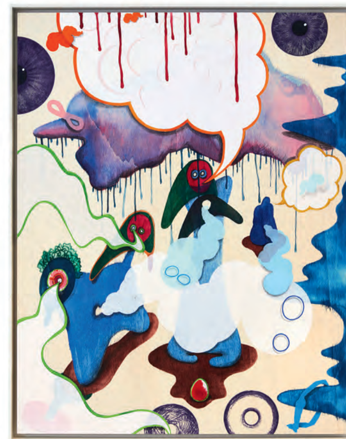
The Cloud , 2021 mixed media, 70 x 55 cm