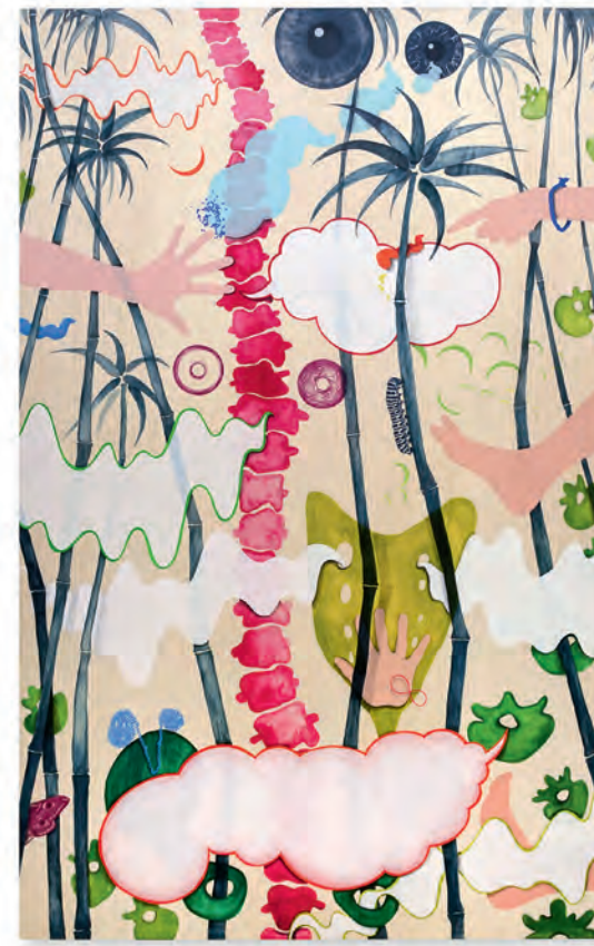
Soft Stars & Das Rückgrat , 2021 mixed media, jeweils 170 x 105 cm