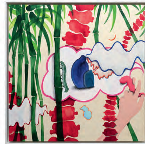
Clan of Ghosts & Big Bubble , 2021 Tusche & Acryl auf Holz, jeweils 60 x 60 cm