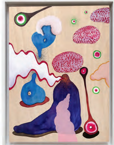
Der Mund & Der Fuß , 2021 mixed media, jeweils 22,5 x 30 cm