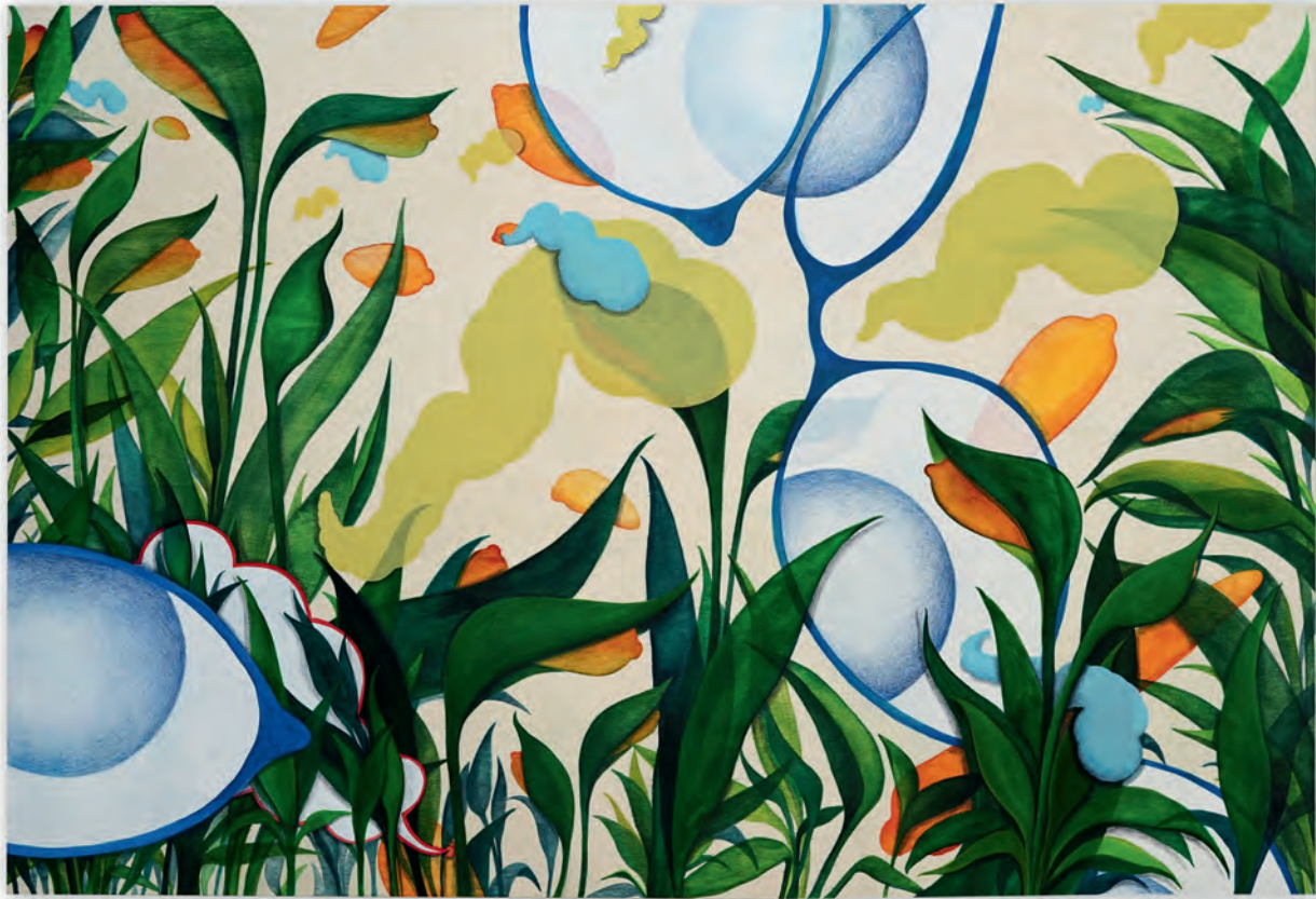
Die Beobachterin , 2021 mixed media, 100 x 85 cm