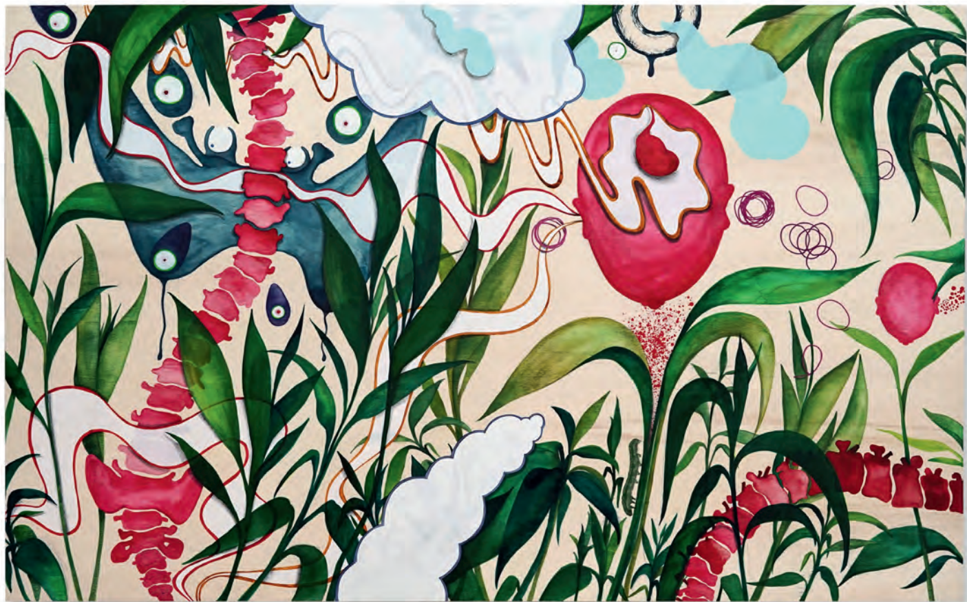
Hybrid 2021, mixed media, 70 x 105 cm