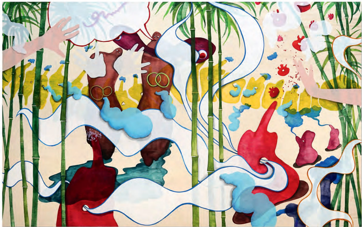
Der Nabel der Welt , 2021, mixed media, 70 x 105 cm