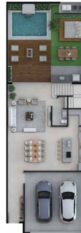
1º Piso - 3 quartos com adicionais