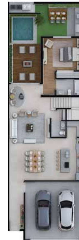
1º Piso - 4 quartos com adicionais