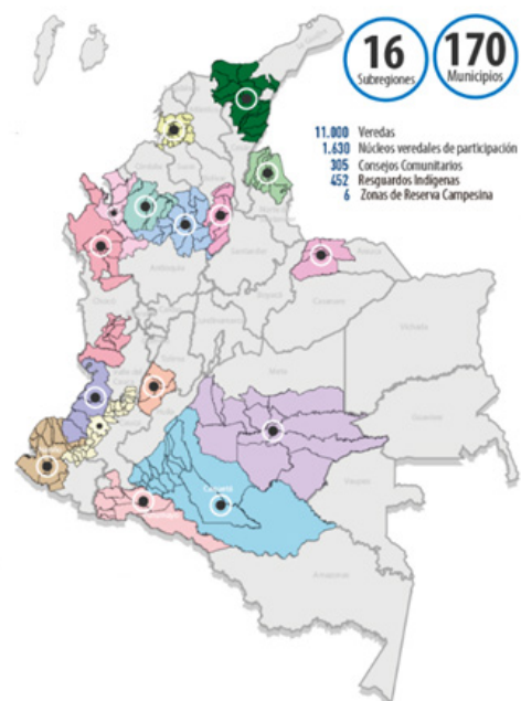
Figur 2: Kort over kommunerne, hvor PDET skal implementeres. Renovacionterritorio.gov.co, (2017), [online]. Tilgængelig på: http://www.renovacionterritorio.gov.co/especiales/especial_PDET/mapa.html

Kortet viser de kommuner, hvor PDET skal implementeres 28 .