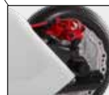
Hand- und Feststellbremse bis 150 kg