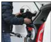
Werkzeugloser Auf- und Abbau