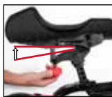
Ergonomisches Kniepolster mit Winkeleinstellung