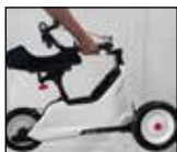
Lenkeinheit als Tragegriff für leichten transport