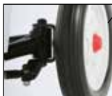
Stoß- und schockabsorbierende Spezialreifen