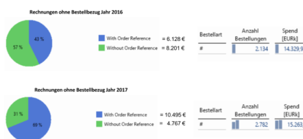
STRUKTURIERTE UND VALIDE POTENZIALIDENTIFIKATION IN JEDER MATERIALGRUPPE

Zunächst wurde im Unternehmen das Einkaufsanalyse-Tool Orpheus im Einkauf erfolgreich implementiert. Mithilfe des Tools konnten Warengruppen entwickelt und die Lieferanten auf die Hauptgewerke gebündelt werden. Zudem wurden Rahmenverträge mit Lieferanten entwickelt und Optimierungsgespräche zur Kostenreduzierung mit ausgewählten Lieferanten geführt