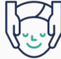
Tests als Zugangsvoraussetzung z.B. für den SPA