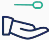
Von Mitarbeitern durchgeführte Tests als besonderer Service für Ihre Gäste