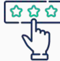
Tests für Ihre individuellen bedürfnisse