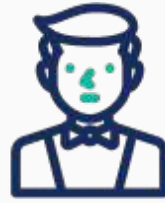
Testen der Mitarbeiter