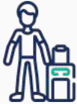
Testen der Gäste vor Ankunft