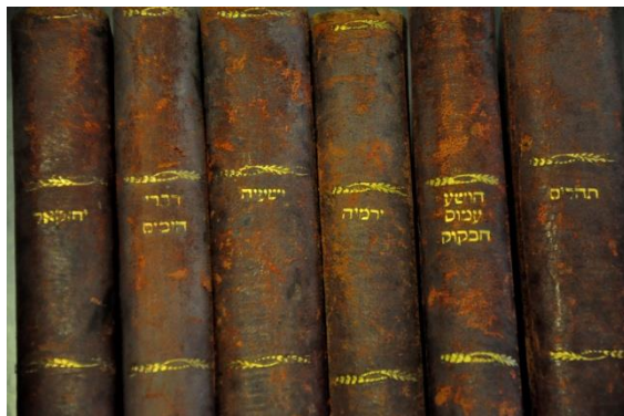
ששת הספרים של סבי

היא פתחה את העיניים עם חיוך קטן, "התקשור הסתיים" היא הכריזה, וכשראתה עד כמה אני נסער המליצה לי על תרגיל נחמד לשחרור, לימים הבנתי שזה סוג של מדיטציה.