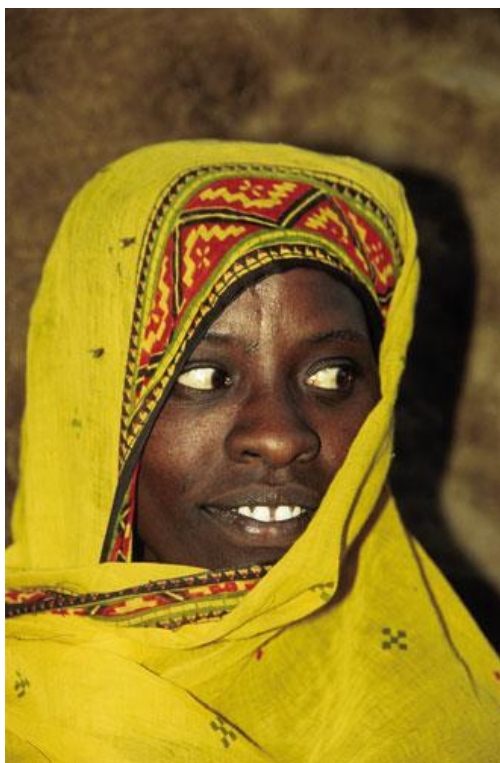
בת שבת אפאר באתיופיה

כדאי לטפס על הר געש מעשן או ללכת שבוע ברגל אל שבת נידח בעבור צילום טוב? תסכן את חיירך? או לפחות תחכה שעתיים לקרן שמש שתציץ מהענן? לא צריך לסכן חיים עבור צילום. אני לא ממליץ על זה. אבל זה קרה לי לא פעם. ברובע הבורסקאים בפס שבמרקו נכנס בי השדון, ונכנסתי לאקסטזה של צילום. בבריכות שבהן צובעים את העורות מצאתי גומחה ובה אדם פושט עור מגופת חיה. שלפתי מצלמה וצילמתי פעמיים. הקליק הבהיל אותי, הוא זרק את העור וזינק לעברי. בנפנפי סכין הוא נתן לי להבין שיש לבקש רשות, וכי בפעם הבאה זה ייגמר אחרת. במסענו לאתיופיה הגענו לאיזור אוואש שבמזרח, וחיפשנו אחרי אנשי השבת אפאר ה"אותנטים" ביותר, לא אלה הקרובים לכביש. שמענו שם סיפורים מפחידים על סירוס אנשים לא רצויים, על תיירים לבנים שנעלמו. בכל פעם שירדנו מהמכונת, הנהג שמר על הרכב כשהמנוע פועל. כשמצאנו מה שרצינו, ניצבנו מול אנשים בעלי תווי פנים מעניינים, לבושים בגדים צבעוניים, שונים מהאחרים באיזור. צילמנו. לפתע עצר לידנו ג'יפ בחריקה. ראש הכפר הציג את עצמו והסביר באנגלית כי אנשי המקום מאמינים שהצילום גונב חלק מנשמתם, אבל סכום מסוים יפדה את הנשמות הגנובות. שילמנו, והוא נסע. אחרי דקות מעטות הקיפו אותנו רוב גברי הכפר, ובחרבות שלופות הסבירו לנו שגם הם רוצים, והרבה. הצבענו על