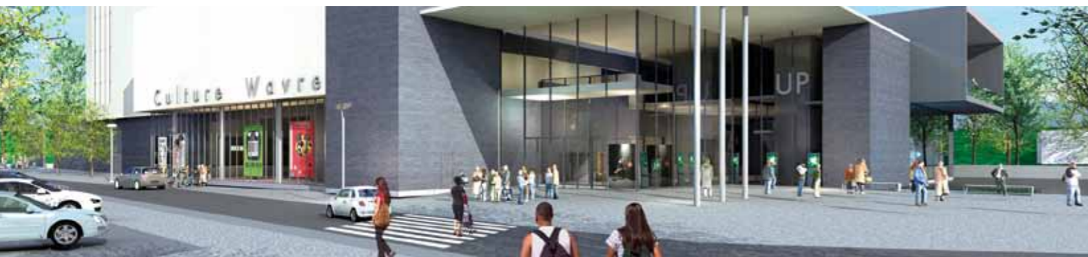
© hall culturel polyvalent de Wavre - ADE - Marc Stryckman and Partners - MONTAIS Partners

Le Brabant wallon est terre de créations théâtrales et musicales. Nos scènes en révèlent la richesse et la diversité. La Province contribue à l'essor de ce patrimoine: elle épaula les opérateurs agissant sur son territoire et finance la construction de nouvelles infrastructures. La kyrielle d'initiatives en cours est la raison d'être de ce dossier consacré à nos... maîtres en scène.