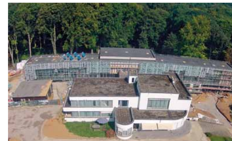
Vue aérienne du « New Building » de la Chapelle Musicale Reine Elisabeth