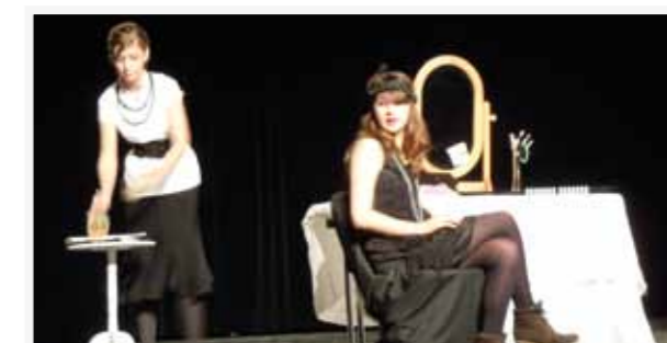
Scène à 2.3 - élèves sur scène

En Brabant wallon, les écoles sont des lieux d'enseignement mais aussi des endroits où développer des activités culturelles, citoyennes ou sportives. Cet éventail, proposé aux élèves de tous réseaux, comprend aussi bien l'organisation de visites au Fort de Breendonk et à la Caserne Dossin à Malines, des animations sportives (Vise ta forme) que d'autres plus axées sur l'environnement, telles que le projet « Plus de vie sur notre planète » du CRIE (Centre Régional d'Initiation à l'Environnement).