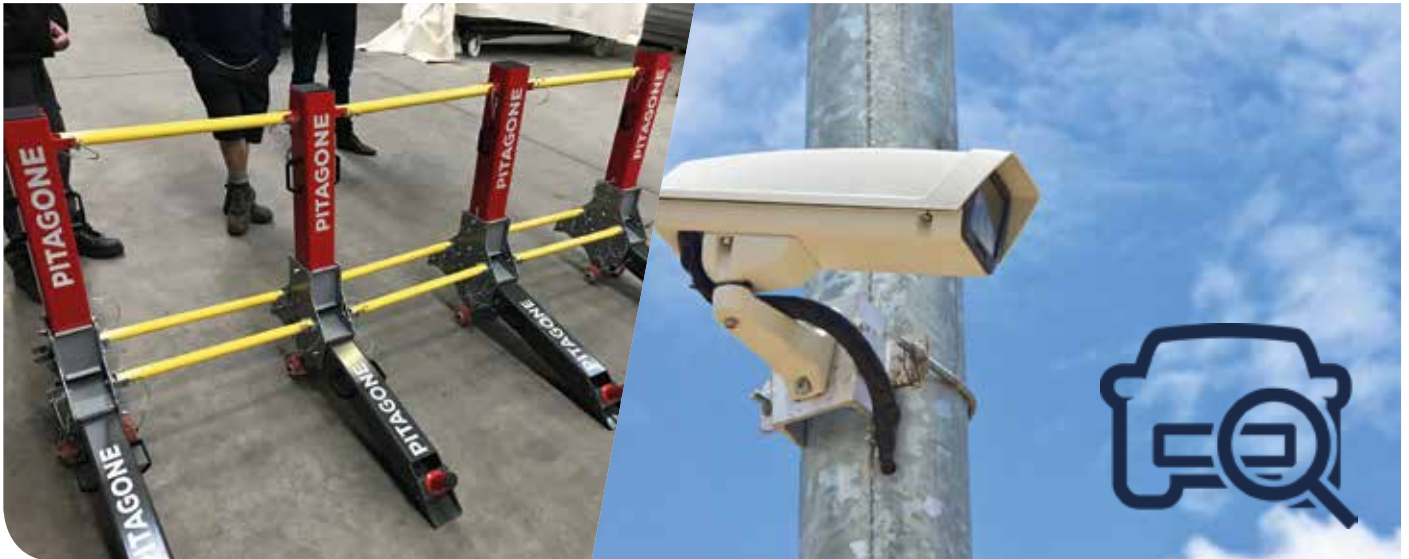
Le Brabant wallon investit en matière de sécurité

En vue de garantir la sécurité de tous, le Brabant wallon continue d'investir dans des équipements sécuritaires tels que des barrières anti-véhicule bélier ou encore un réseau de caméras de sécurité.