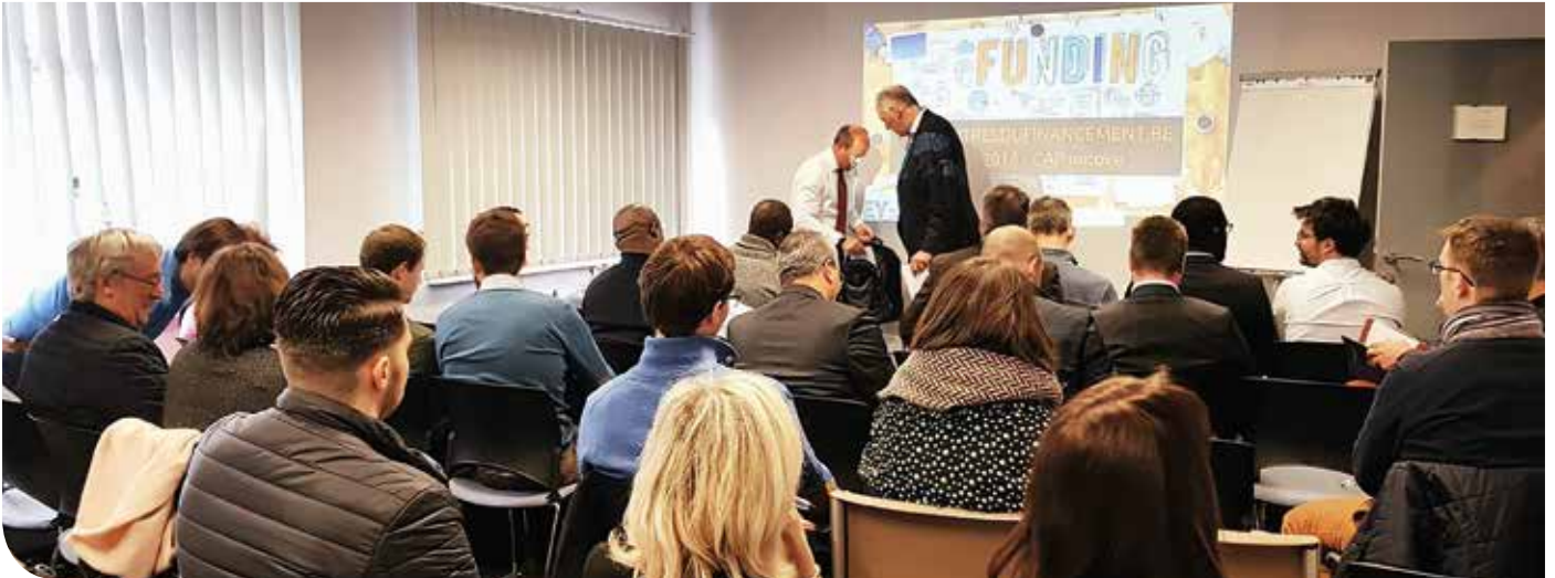
L'asbl accompagne notamment les porteurs de projet à la création d'entreprise.

Depuis plus de dix ans, le Brabant wallon a investi plus d'un million d'euros au sein de CAP Innove, un centre d'entreprises innovant situé à Nivelles.