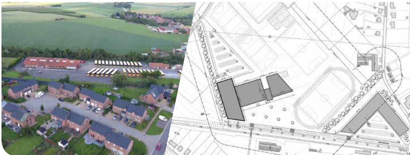
Le futur hall sportif et polyvalent devrait s'étendre sur 12 hectares.

Le 23 juin 2016, le hall sportif de Jodoigne était détruit par une impressionnante tempête. Aujourd'hui, les autorités communales ont le projet de créer un nouveau pôle sportif et polyvalent baptisé « Plaine de la Gadale ».