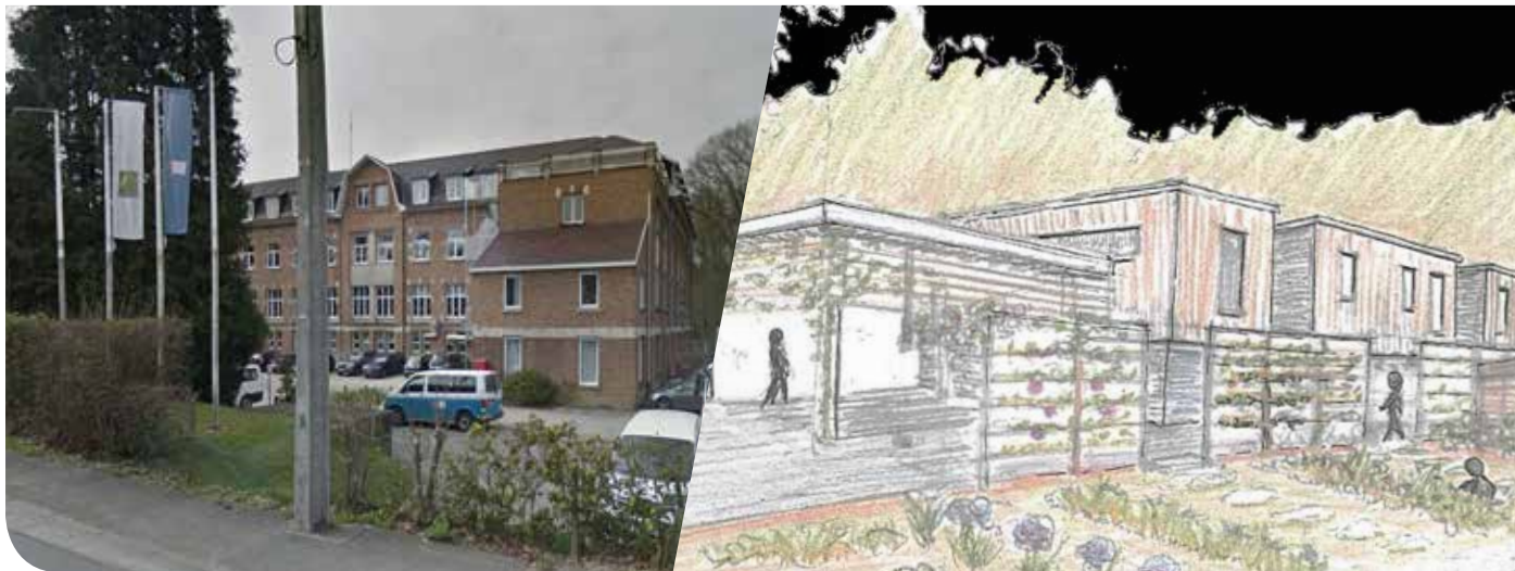
© Esquisse partielle des nouvelles infrastructures et de leurs jardins thérapeutiques.

L'Institut médico-pédagogique d'Héவில் (Mont-Saint-Guibert) va être rebâti. De nouvelles infrastructures sortiront de terre en 2022. Elles seront mieux adaptées à leurs hôtes porteurs de handicaps ou sujets à des troubles du comportement.