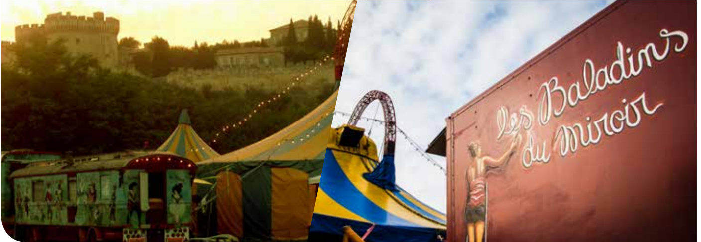
© C'est au cœur des villes et villages que les Baladins du Miroir installent leur chapiteau.

Défendant un théâtre populaire et festif, les Baladins du Miroir créent un rapport privilégié et intime avec leur public. Ils accueillent chaque année près de 30 000 spectateurs.