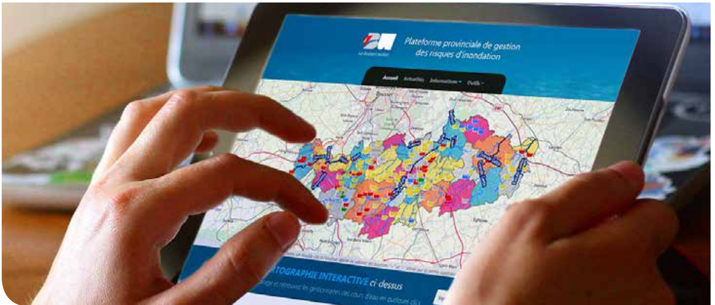
© Consultation des bassins d'orage existants en Brabant wallon sur la Plateforme Inondation.

Derrière l'appellation « carte » se cache souvent l'idée d'un document imprimé représentant et localisant de manière statique une thématique particulière.