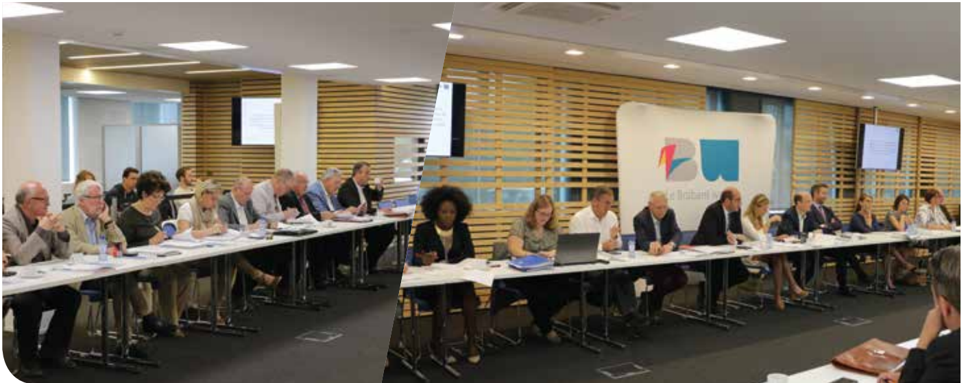
© Le Conseil 27+1 à l'Espace Brabant wallon.

Jamais le Brabant wallon n'a été aussi proche, aussi à l'écoute, aussi attentif aux attentes de ses 27 communes et à travers elles de l'ensemble des Brabançons wallons.