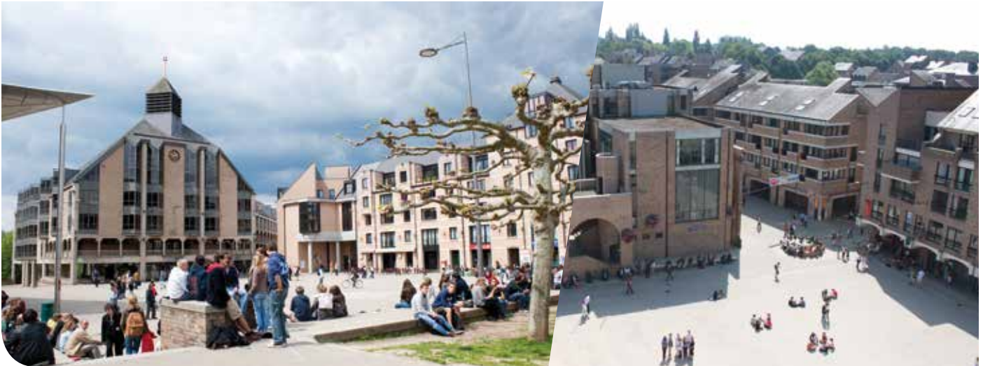
La Grand-Place de Louvain-la-Neuve et la Place de l'Université.

En créant Louvain-la-Neuve, l'UCL a insufflé une dynamique majeure. La première université francophone du pays fait davantage que former 30 000 étudiants : elle appuie le développement économique du Brabant wallon et, partant, du pays tout entier.