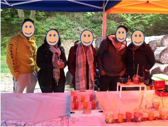
Table avec diverses spécialités kurdes, afghanes et érythréennes, devant la salle des spectacles :

Fête de quartier multiculturelle en mai :