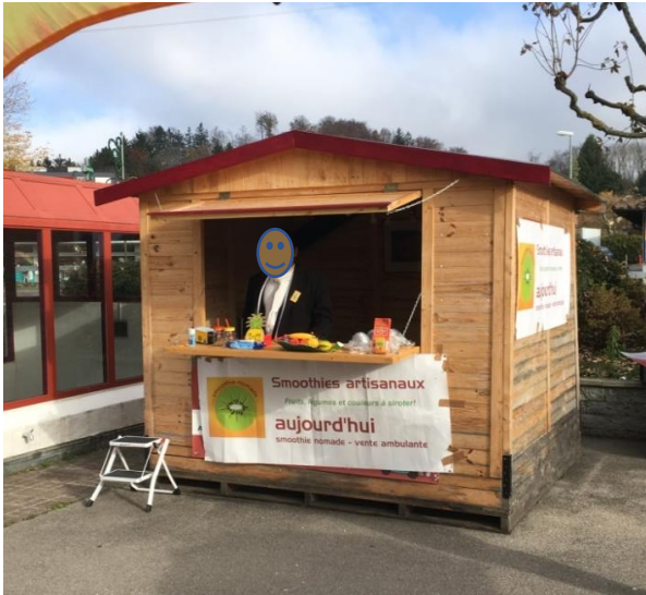
Le chalet de l'association Lulu aux Croisettes, Epalinges

Le généreux soutien de la Chaîne du Bonheur sur 18 mois (mai 2018 à octobre 2019) nous a été très précieux et utile. Il nous a permis, d'une part, de perfectionner notre fonctionnement au niveau opérationnel et stratégique, de passer d'un système de semi-bénévolat à la création de postes correctement rémunérés pour nos formatrices qualifiées et pour un conducteur de notre véhicule tricycle, et de confier notre comptabilité à un spécialiste externe. D'autre part, ce soutien a également grandement contribué à nous donner plus de visibilité (grâce à la collaboration avec un jeune directeur artistique) et plus de crédibilité et de professionnalisme envers nos partenaires et envers les institutions du social. Ainsi, nous avons pu formaliser notre collaboration avec le CSIR (Centre social d'intégration des réfugiés) pour 2020, dans le but de pérenniser notre programme. Mais en tout premier lieu, cette aide financière nous a permis d'accueillir et de former un grand nombre de participants fragilisés, peu scolarisés et en manque de lien social.