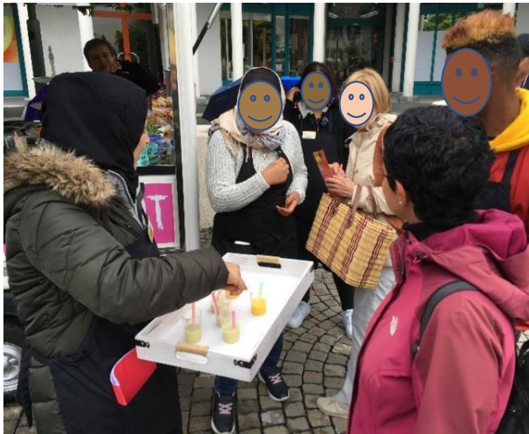
La place du marché à Epalinges – lieu de dégustations, de contacts et de rencontres

Notre programme a lieu à Epalinges sur 5 matinées par semaine et représente une combinaison bien réfléchi de formation en classe (environ 80 à 90%, selon les saisons) et de dégustations, ventes et autres activités en dehors de nos locaux. En accord avec les instances du social, les participants ne sont pas rémunérés pour ces heures d'activités collectives, qui nécessitent beaucoup de coaching et d'encadrement. En retour, ils reçoivent des bénéfices matériels (goûter et boissons, sorties, agenda, vêtement de travail etc.) et immatériels, à savoir beaucoup de compliments et de reconnaissance pour leurs produits! Il est parfois touchant de voir des clients fidèles revenir et reconnaître nos participants – et vice versa. Être connu et re-connu, c'est signe que vous comptez pour les autres, que vous existez, que vous commencez à avoir votre place dans la société d'accueil.