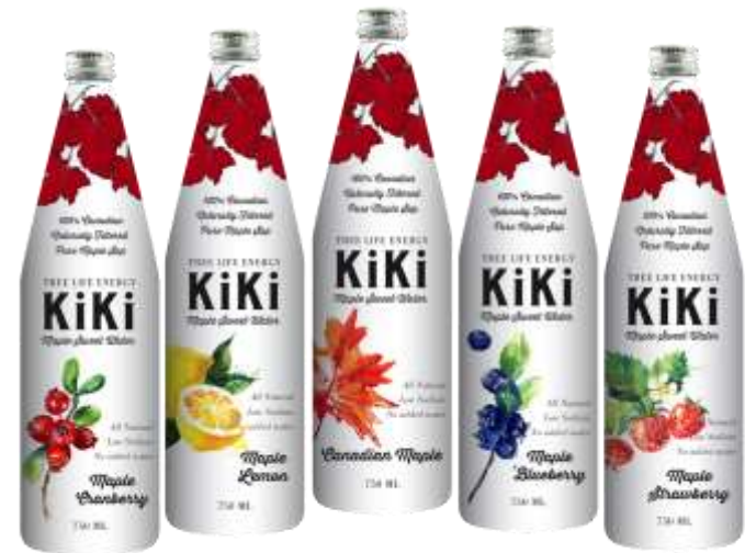
クランベリー レモン ナチュラル ブルーベリー ストロベリー