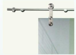
Glijrail - 'Inox'