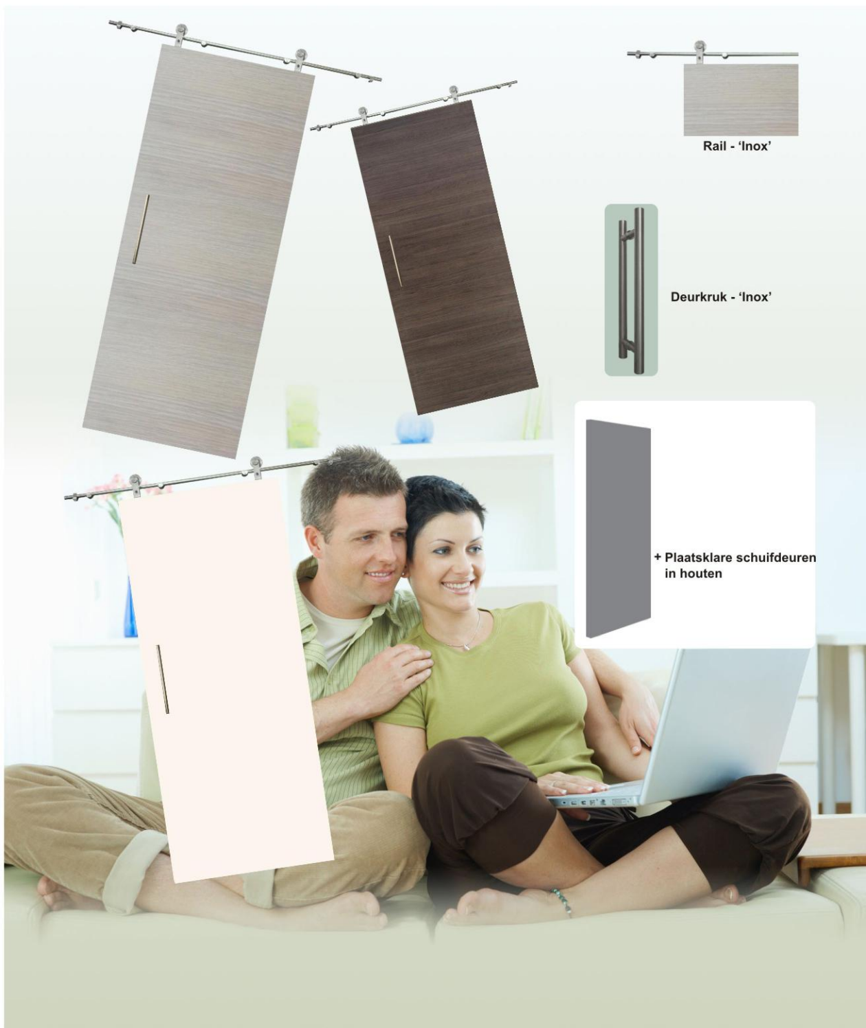
Rail - 'Inox'