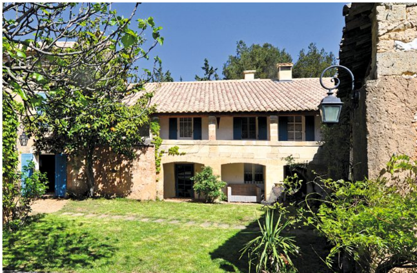
Un superbe mas situé près d'Avignon pour 1,55 million d'euros.

À Rochefort-du-Gard, tout près d'Avignon, l'agence Émile Garcin-Saint Rémy de Provence propose un authentique mas en pierre aux volets bleu lavande – une ancienne ferme royale remontant au XVIII e siècle – au milieu de 13 hectares superbement plantés d'oliviers, de cyprès, de cèdres, de pins et de fruitiers. Un magnifique dallage ancien, de belles poutres apparentes, une grande cheminée d'époque, une loggia ouverte sur le jardin assurent le charme des lieux, au demeurant rénovés dans un style confortable. L'intérieur se compose de la spacieuse chambre de maître dotée d'une belle cheminée et de quatre chambres. Un mazet (dépendance) sert de salle de sport. Les férus d'équitation y trouveront des boxes pour chevaux et les œnologues une cave à vins. Sans compter une orangeraie et une belle piscine de 6 x 11 m. Le prix, 1,55 million d'euros, se situe dans le marché pour ce type de biens recherchés.