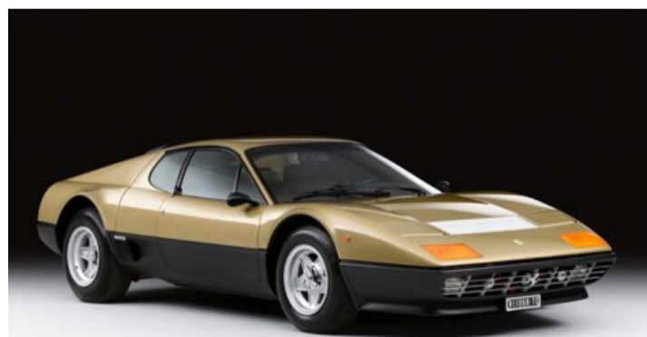
Etimée au-dessus d'un demi-million, cette Ferrari couleur or est le lot phare de la première vente dédiée à l'or par Sotheby's, le mercredi 17 octobre à Londres.

L'occasion rêvée d'acquérir une chaise ayant appartenu à l'empereur Napoléon, un buste de Kate Moss en or massif, signé Marc Quinn, un jéroboam de Cristal Brut Louis Roederer 2002, proposé dans son écrin doré, une boîte à musique du début du