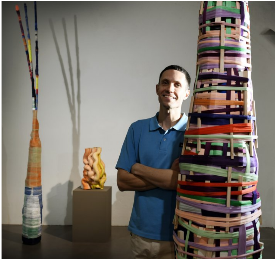
En place du 12 octobre au 15 décembre, l'exposition «Visual Vertigo» réunit pour la première fois les deux pans du travail d'Anton Alvarez: ses sculptures en fils et ses céramiques.

Pour accélérer le processus de création, Anton a alors l'idée de construire une machine qui simplifierait l'emballage. Après une année de recherche et de développement, «The Thread Wrapping Machine» voit le jour en 2012. Elle se compose d'un cylindre tournant monté sur pieds, sur lequel peuvent être fixées des bobines. Situés des deux côtés de