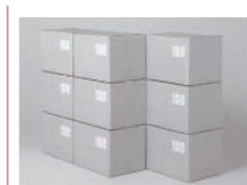
Etikete za otpremninu