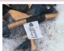
Etikete za napomene