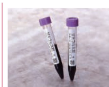
Za medicinsku upotrebu