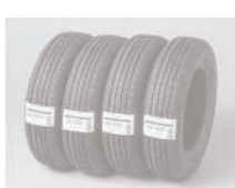
Etikete za inventar