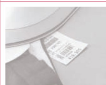
Tagovi za cene