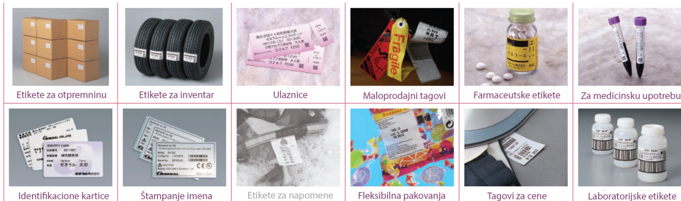
Etikete za otpremninu