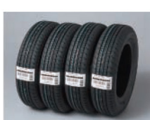
Etikete za inventar