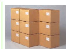
Etikete za otpremninu