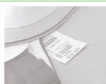
Tagovi za cene