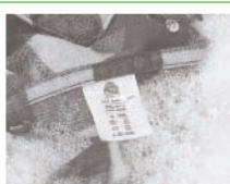
Etikete za napomene