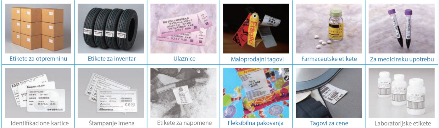
Etikete za otpremninu