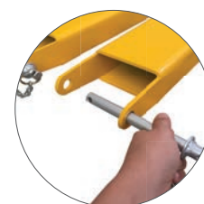
PINO DE BLOQUEIO Sistema de travamento na base do garfo com pino de bloqueio.