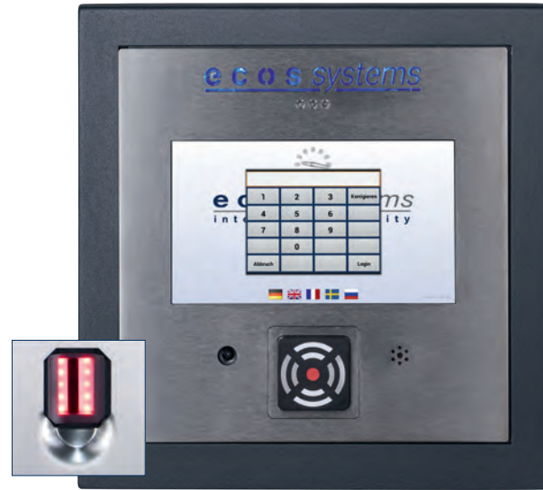
Terminal ecos 7", utilisé comme système d'accès et d'intercom avec RFID ou lecteur d'empreintes digitales