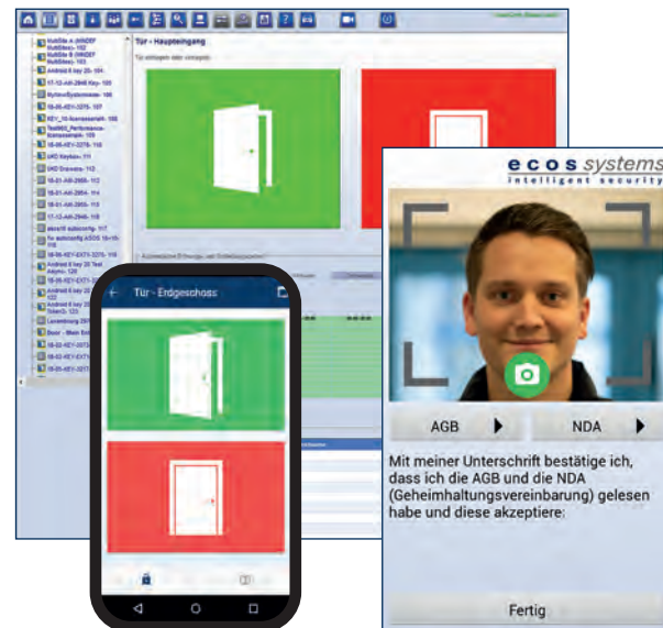
Enregistrement des visiteurs