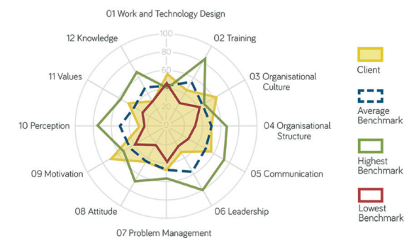
Radar für die Vergleichsanalyse

Bei regelmässiger Wiederholung belegen die Ergebnisse Änderungen in der Informationssicherheitskultur und helfen, Ihre Investitionen zu rechtfertigen.