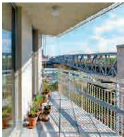
Außenraum mit Blick zum Park