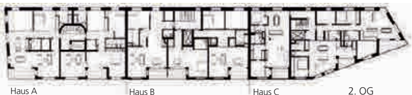
Flexible Grundrisse ermöglichen die Anpassung an verschiedene Lebenssituationen.