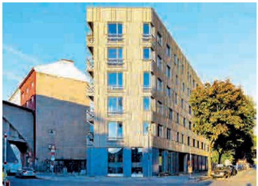
Blick vom Park