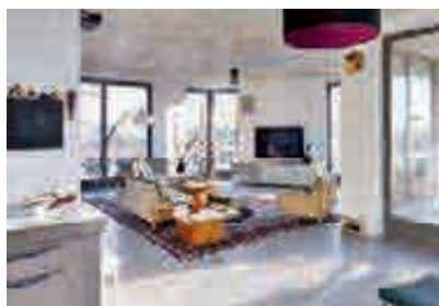
Die Grundrisse lassen eine zeitgemäße Kombination von Wohnen und Arbeiten zu.