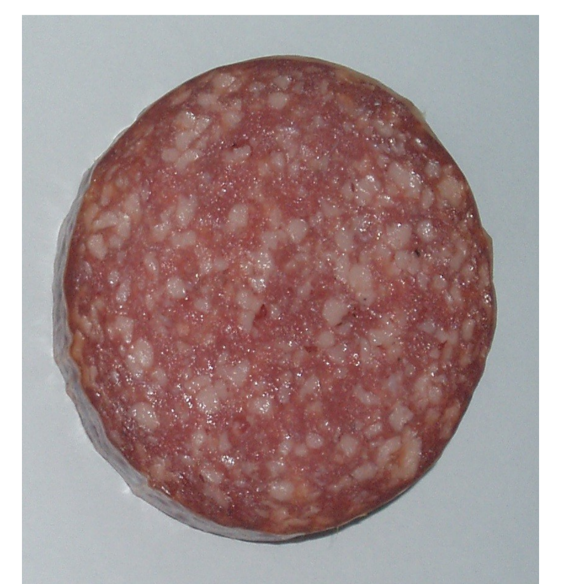
5-10 % Fett