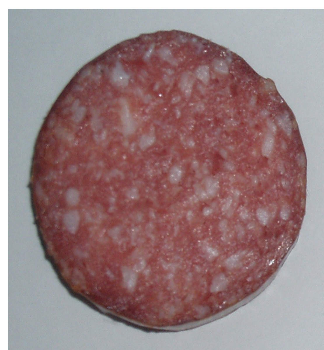
etwa 35 % Fett

Schnittbilder von konventioneller Salami (mit Speck) und fettreduzierter Salami (mit Fettaustauschstoff)