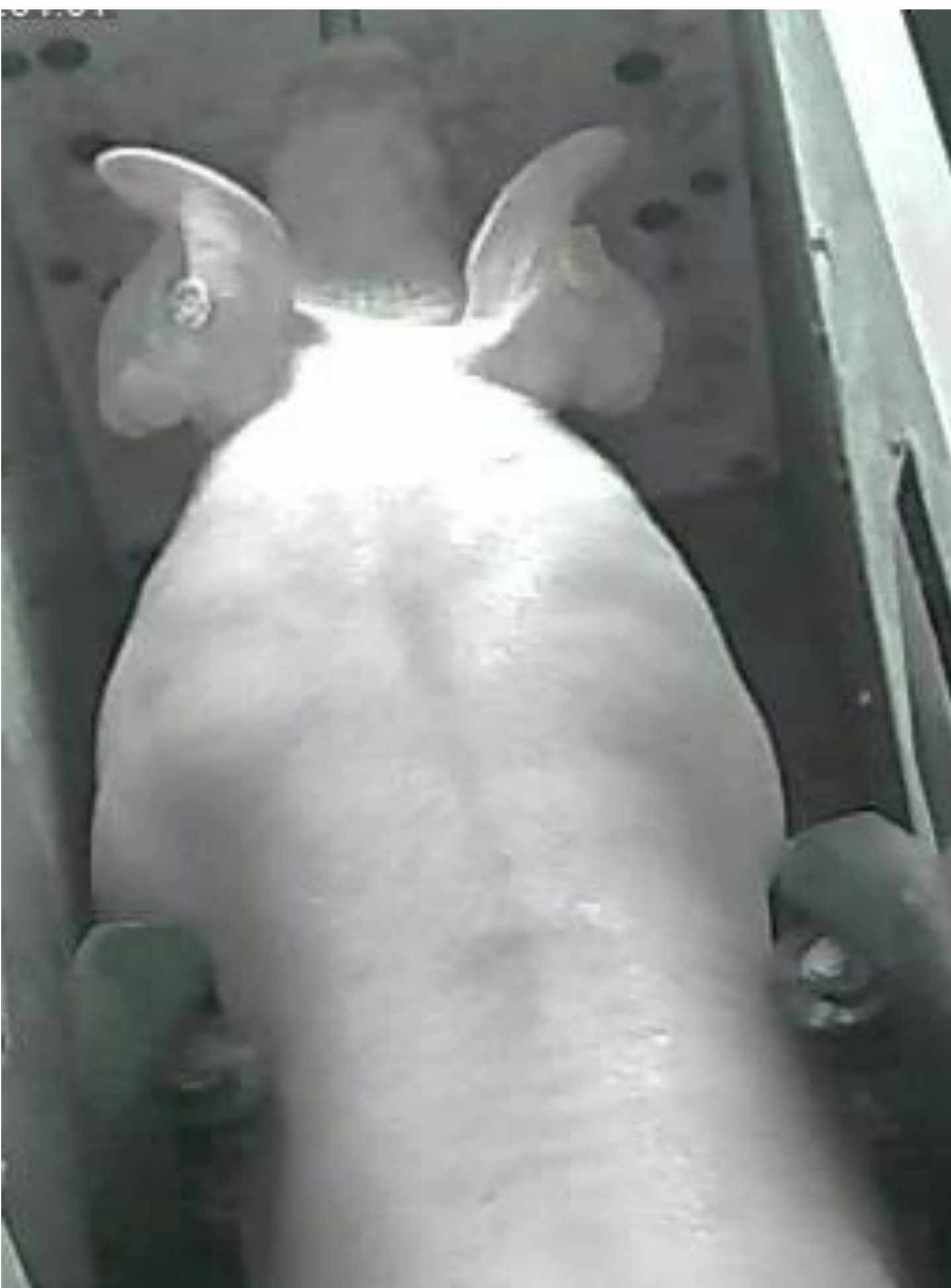
Wägung und Bioimpedanz-Messung eines Mastschweines im ConditWatch® -System