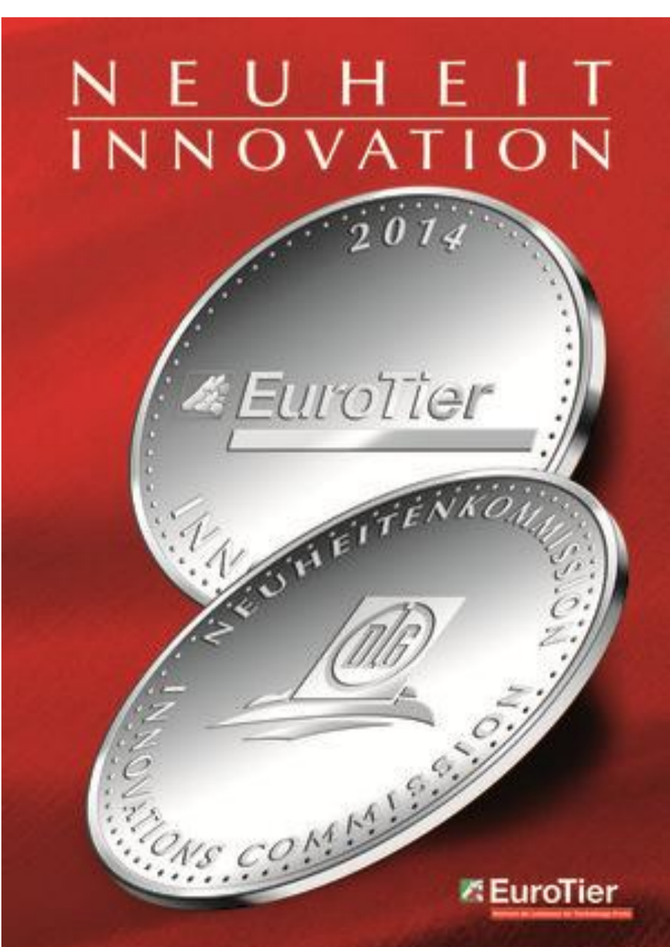
Ausgezeichnet mit der Silbermedaille der DLG-Expertenkommission auf der EuroTier 2014

Auf Grundlage der mehrmals täglichen Messung der Bioimpedanz erfolgt eine Berechnung des Körperfettanteils des Einzeltiers. Mit zunehmendem Körpergewicht der Mastschweine kann auch bei ausgewogenem Fett-Muskel-Verhältnis eine Zunahme der Bioimpedanz festgestellt werden, da der Körperfettanteil mit fortgeschrittenem Mastverlauf in aller Regel ansteigt. Auf Grundlage eines Tagesmittelwertes des Einzeltieres kann eine Empfehlung zur voraussichtlichen Schlachtreife generiert und anschaulich durch die systemeigene Software angezeigt werden. ConditWatch® kann aufgrund der mobilen und leicht zu handhabenden Bauweise an die Anforderungen eines jeden Betriebes angepasst und flexibel in unterschiedlichen Stallabteilen eingesetzt werden. Es kann unabhängig von Rasse, Größe, Alter und Geschlecht in jedem Maststadium zum Einsatz kommen.