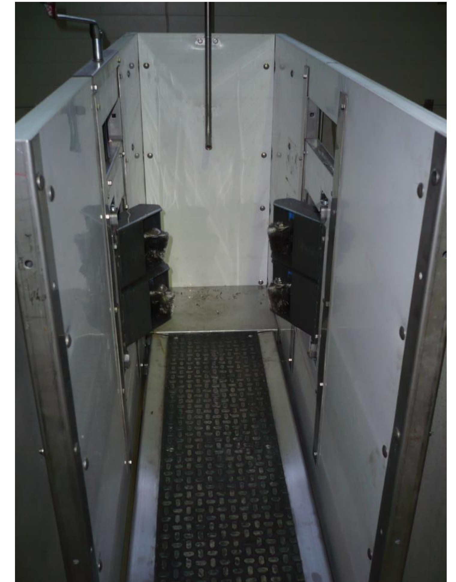
ConditWatch® – Innovatives, nicht-invasives sensor-gestütztes Konditionsmonitoring für Mastschweine

Die moderne Schweinemast strebt bei täglicher Mastzunahme von 800 g ein Mastziel von 120 kg im Alter von 4-5 Monaten an. Ist eine Erlössteigerung durch ein höheres Schlachtgewicht beabsichtigt, so besteht das Risiko eines Übermästens, insbesondere in der Ebermast. Eine Verschiebung des Fett-Muskel-Verhältnisses hin zu einem erhöhten Fettansatz führt neben höheren Futterkosten auf dem Schlachthof zu erheblichen Erlöseinbußen. Um dem entgegen zu wirken, ist mit dem System ConditWatch® eine bisher nicht gekannte Effizienz und Transparenz für den Mastverlauf eines jeden Einzeltieres zu erzielen. Die angestrebte Gewichtsklasse soll unter Berücksichtigung der Fleischqualität mit geringerem personellen Aufwand und mit gesteigerter wirtschaftlicher Effizienz bei einem Mehr an Tierwohl erreicht werden.