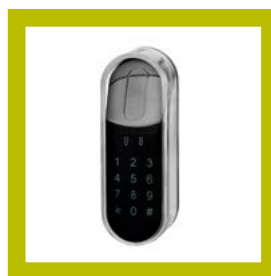
Lecteur Touchpad (code)