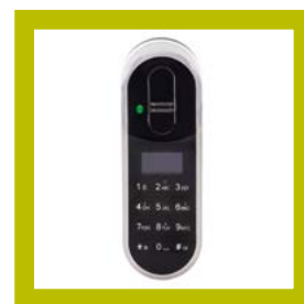
Lecteur Touchpad+ (code et empreinte digitale)