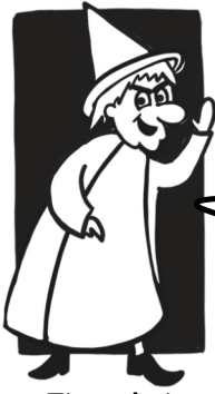
The witch La bruja